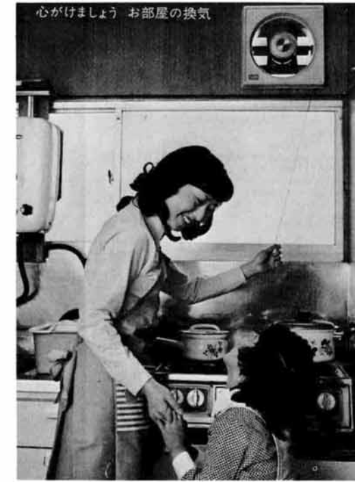
心がけましょう お部屋の換気

冬季のガス需要期を迎え、今年も暖房器具などの使用する季節となりました。毎年の期間は全国一斉にガス安全使用強化運動が実施されます。 十一月一日からは供給熱量が、一月キロワットに変わりました。ガスを正しく使用するため、ガス器具に、換気施設と、換気設備の点検を行い、ガス中毒事故のな