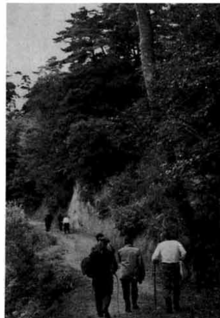
紅葉しはじめた樹形城跡をたずねる老人

七月から町教育委員会、公民館主催で高令者教室を開いております。この教室は家庭にとじこもりがちな老人に、学習と話し合いの場を提供し、未来に希望をもって生きてもらうという目的で始められ、六十五才以上の方々五十名が参加しています。年間十三回による学習は、社会変化の理解、若い世代の理解、健康の維持、趣味等の内容です。文部省でも、近年の高令者人口の増加と出生児数の減少による人口の老化現象、核家族化に伴う老人夫婦世帯と単身老人世帯数の著しい増加などが生じており、老人が孤独からどう解放され、老後の積極的な生きがいを得ようか等の問題をかかえ、これまでの医療保障や老人福祉、老人就労の施策に加えて、高令者自身による社会的適応の学習精神的、情緒的な