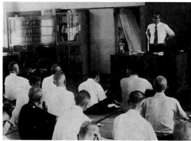
熱心に講義を聞く(8月)

口の老化現象、核家族化に伴う老人夫婦世帯と単身老人世帯数の著しい増加などが生じており、老人が孤独からどう解放され、老後の積極的な生きがいを得ようか等の問題をかかえ、これまでの医療保障や老人福祉、老人就労の施策に加えて、高令者自身による社会的適応の学習精神的、情緒的な