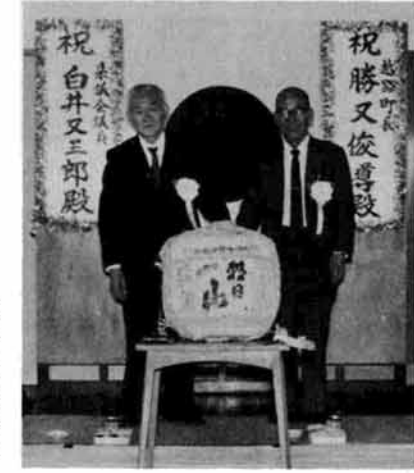
生前中の白井県議 (昭和46年)