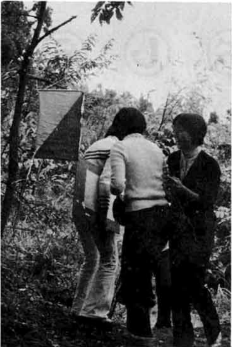
ポストを見つけて喜び参加者

十月二十日(日)公民館主催により、越路原周辺を会場に行われました。このオリエンテーリング(OLと呼んでいる)とは、歩く/走る! 体の基本運動の舞台を大自然に求め、オソンのいっばいある山野を地図と磁石を用い、あらかじめ示された形式、方法で山野の中に設定したいくつかの地点(ポスト)をチェックポイント)をできるだけ短い時間に探しあててゴールする競技で、地図の読み方、磁石の使い方を知っていただければ、歩ける人なら誰でも参加でき、今日日本中で急激に普及してきたスポーツです。