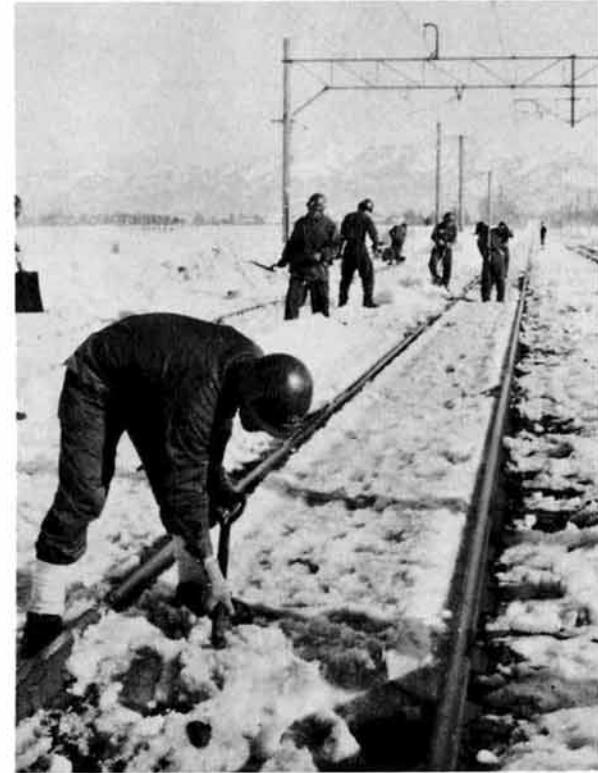
自衛隊員による除雪作業

雪国にはめずらしく二年も続いた暖冬。冬国に住む人々の生活をめくるくし、生活にうるおいを与えた四十六、七年はしのぎやすい冬であった。 夢よもう一度と三年続きの暖冬を心待ちしたが、例年よりも早く十二月三日には初雪が降り、しかも初雪は消えることなく断続的に降り続く……。 十二月二十三日から二十六日までの四日間降り続いた雪は、信越線の上下列車のほとんどを二日間にもわたり不通にさせたり、主要道路である県道を完全にマヒさせ、積雪は二メートルを超えるまでになった。