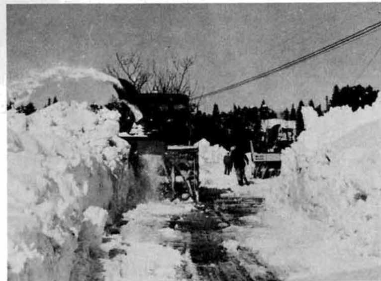
昼夜通しての除雪 (県道不道沢地内)

歳末で忙しく走り廻らなければならない人も車も、屋根に積った身の丈ほどの雪おろしに汗をかき、どか雪に不満をぶちつけたいっぱい雪を投げている。 二十六日には、不通に近い信越線各駅に高田自衛隊員が二日間来迎寺に九十名、塚山に七十名が線路の除雪に協力した。また、地元消防団百名は自分達の屋根の雪下ろしもかまわず信越線の除雪に協力。 このどか雪で道路はいたるところに立ち往生した車や路上駐車除雪がスムーズにできず、苦心の連続であった。