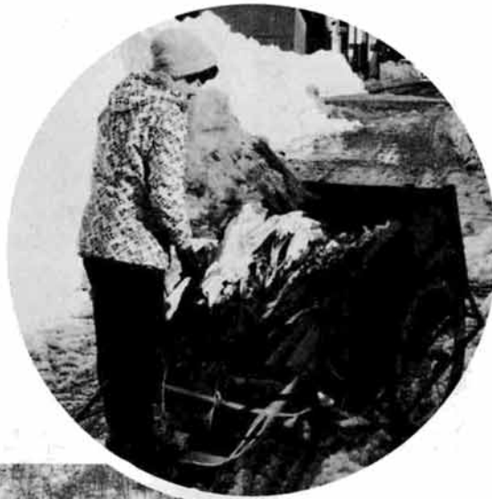
→正月用の花を売る (来迎寺)

最近の異常な物価高、物不足を乗り越えるには、国、県の対策はもちろんな必要ですが、なんといても我々一徳国民の協力が必要とされています。業者は社会的責任において買占め、売惜み、不当な値上げを慎み、消費者も買いためなどの行動に走らないことです。また、私達は常にテレビ、新聞などの情報を積極的にキャッチし冷静に事態をみつけ、無駄をはぶき、可能な節約を工夫し実行することが必要ではないでしょうか。県は昨年末に県民生活安定対策本部(電話新潟23-5511)を設置し、いろいろな対策をすすめています。皆さんからの情報や苦情相談にも応じています。また、町でもこの関連事務の窓口を産業課に設置しましたので、みなさんのご協力をお願いします。