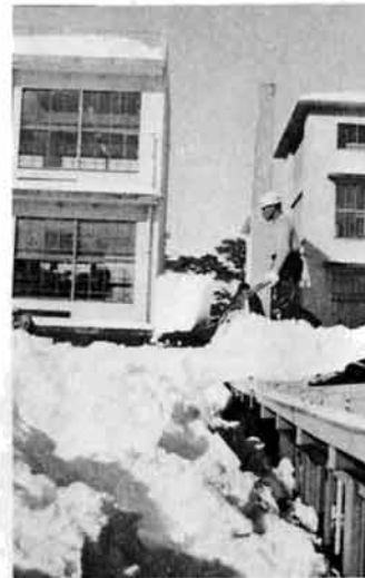
すっぽり雪にうまった 渡り廊下 (越中)