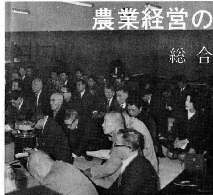
第1回指導者研修会

町の農業は、都市計画区域の指定、農業振興地域の指定などにより大きく変わろうとしています。農業の機械化、経営の近代化により安定した農業経営を目指す農業者の育成および畜産等公害の発生を未然に防止し恵まれた環境のもとに経営ができるよう、農業委員会では、農業者のために構造政策推進農家対策事業を実施しています。