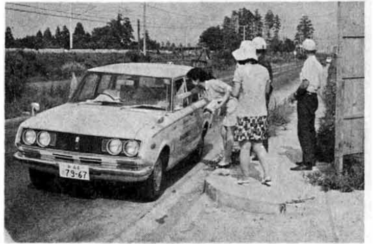
浦来迎寺間に設置された交通安全指導所

夏の交通事故防止運動を推進するため、この運動期間中各所で交通安全指導所が開設されました。