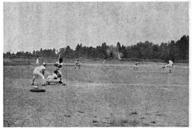
大石組チームと 役場チームの対戦

遠くから長い距離を運転してきた人、行楽帰りの人、仕事で運転中の人、警察官の停止の合図でチョッ