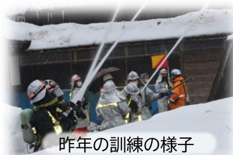
昨年の訓練の様子