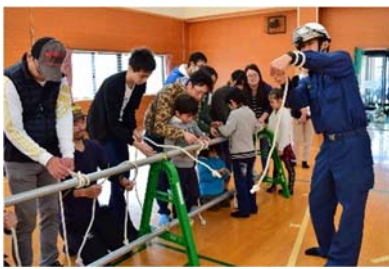
▲消防署職員によるロープ結束訓練