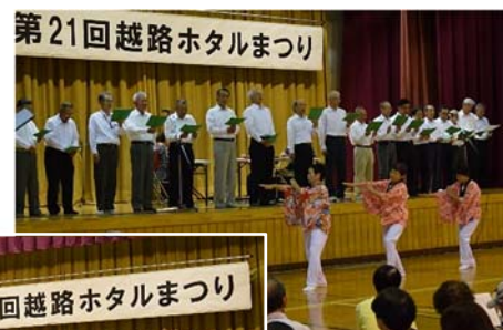
第21回越路ホタルまつり