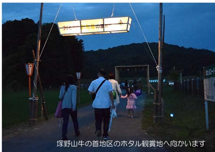
塚野山牛の首地区のホタル観賞地へ向かいます