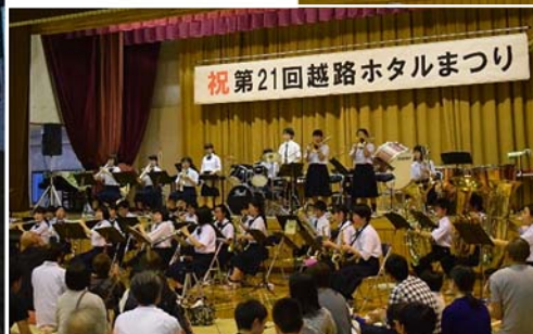
◀ 越路中学校吹奏楽部の演奏