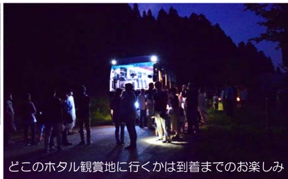
どこのホタル観賞地に行くかは到着までのお楽しみ