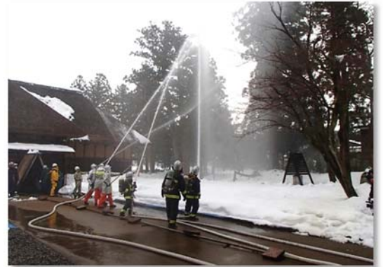
↑ 昨年の長谷川邸消防訓練の様子