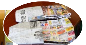
新聞紙のスリッパ