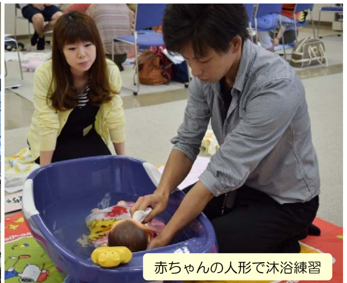
赤ちゃんの人形で沐浴練習