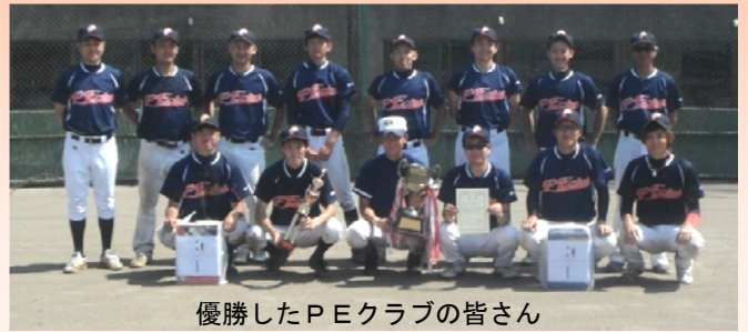
優勝したP Eクラブの皆さん