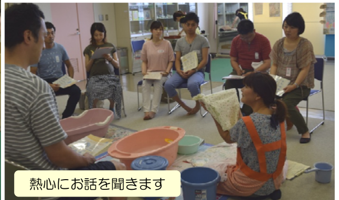
熱心にお話を聞きます

8月19日越路保健センターで「パパママサークル」が開催され、10組のご夫婦が参加されました。助産師・保健師の指導で新米パパが新生児の体重3kgの人形を使って沐浴練習をしました。約5kgの重りを付けて妊娠後期を想定した妊婦疑似体験では、足元が見えなくなったり重くなった体に悪戦苦闘！妊婦さんの日常動作の大変さを実感していました。