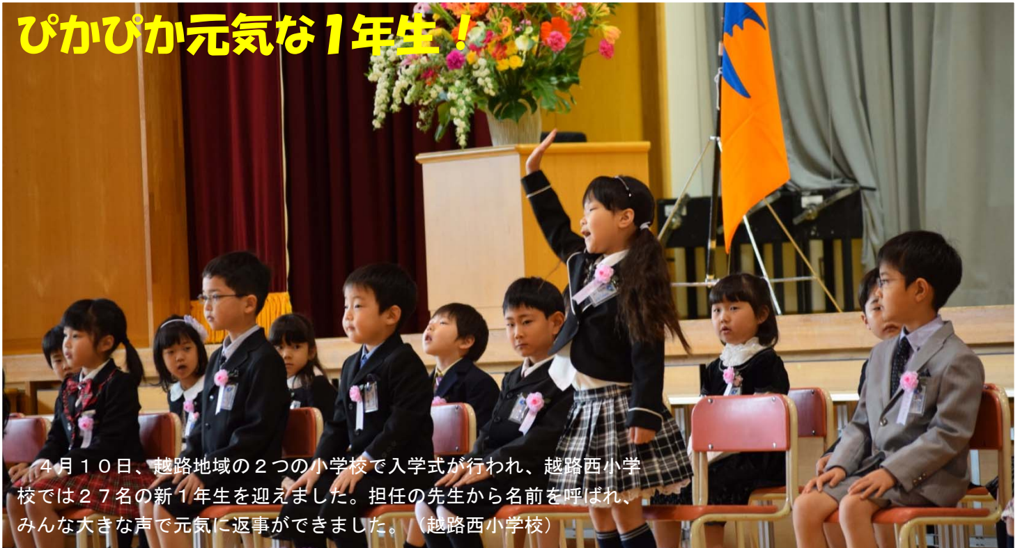
4月10日、越路地域の2つの小学校で入学式が行われ、越路西小学校では27名の新1年生を迎えました。担任の先生から名前を呼ばれ、みんな大きな声で元気に返事ができました。(越路西小学校)