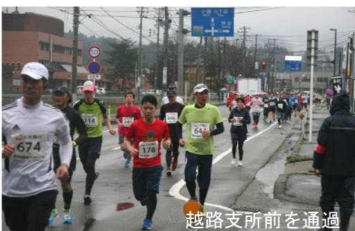
越路支所前を通過