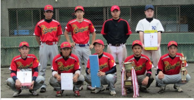
優勝 「来友ネッツーズ」