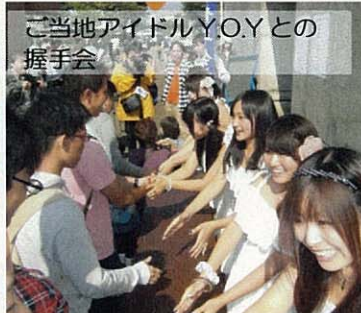
ご当地アイドルYOYとの握手会