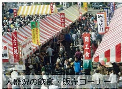
大盛況の飲食・販売コーナー