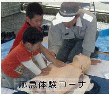
応急体験コーナー