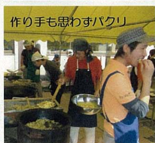
作り手も思わずパクリ