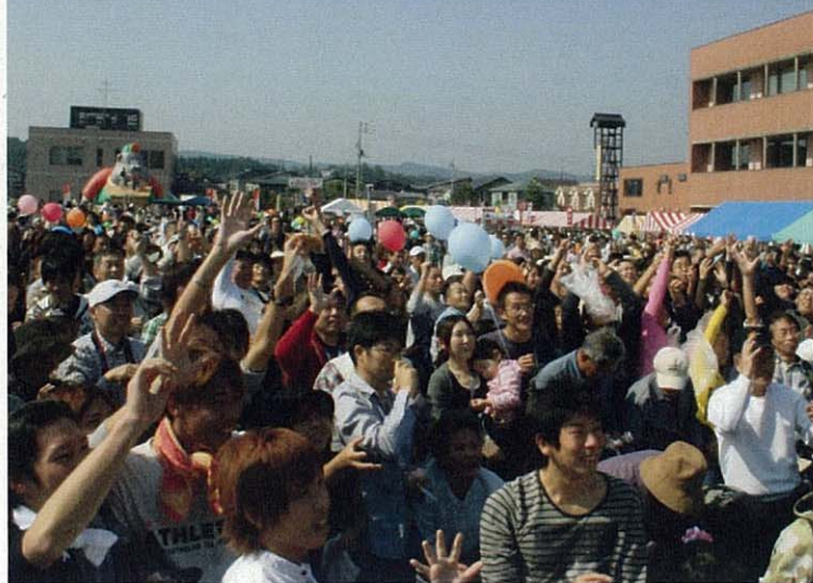
大人気のほたるもち播き