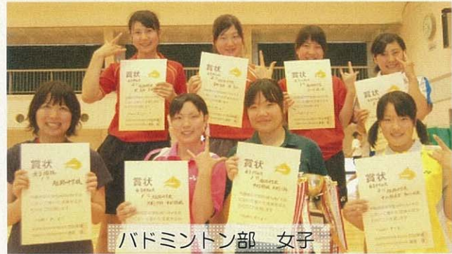
バドミントン部 女子