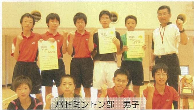
バドミントン部 男子

上記に入賞した皆さんは7月26日からの県大会に挑みます。北信越大会に向けてGO!GO!