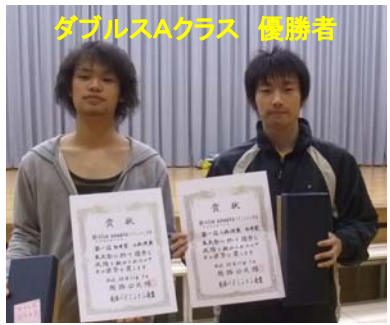
ダブルスAクラス 優勝者

11月7日(日)第25回越路地域市民バレーボール大会が越路体育館にて、また第42回越路地域市民バドミントン大会が越路西小学校にて行われました。