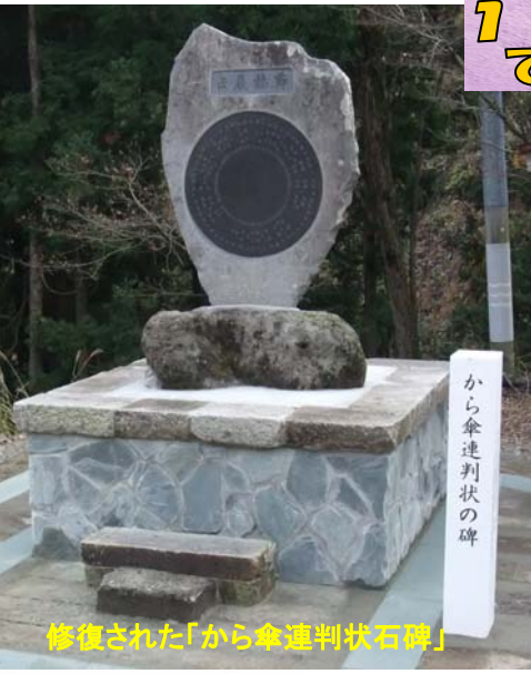
修復された「から傘連判状石碑」

今日では、折角の郷土史跡も歴史の風化により忘れられた存在となっていました。中越大震災、中越沖地震で大きく被災したため、から傘連判状石碑保存会を設置し、関係集落皆様のご協賛により、11月5日に修復されました。