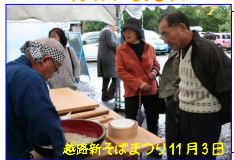
越路新そばまつり11月3日