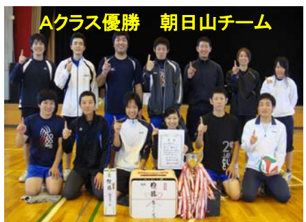
Aクラス優勝 朝日山チーム

バドミントン大会結果 団体戦 優勝 中野島BC(A) 準優勝 中野島BC(B) 三位 中野島BC(C) 越路JBC