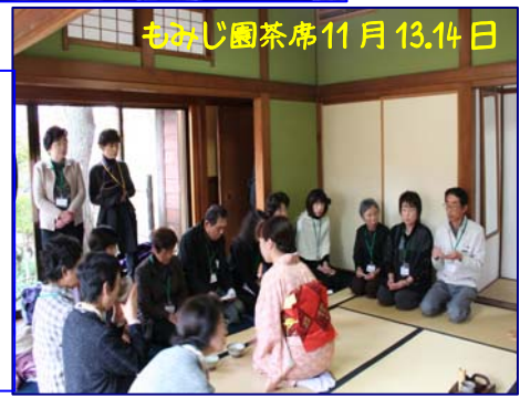
もみじ園茶席11月13,14日