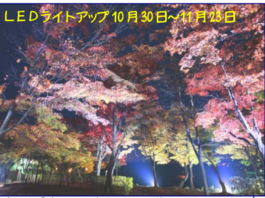
LEDライトアップ10月30日～11月23日