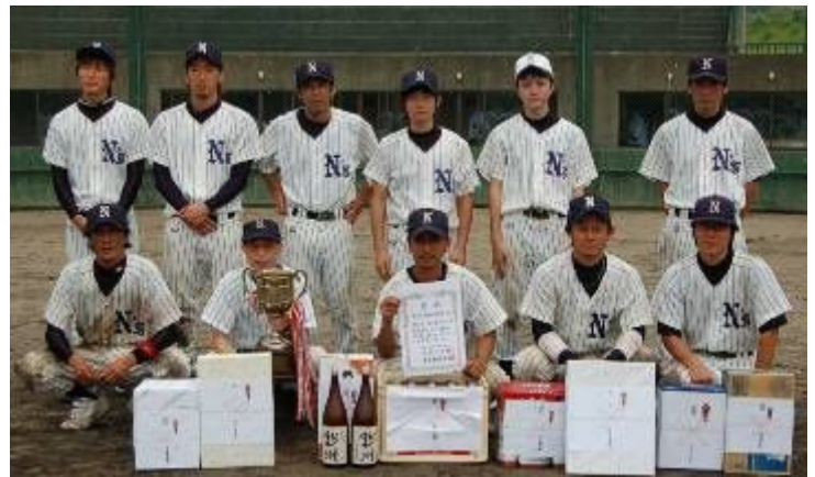
優勝した来友ネッシーズの皆さん