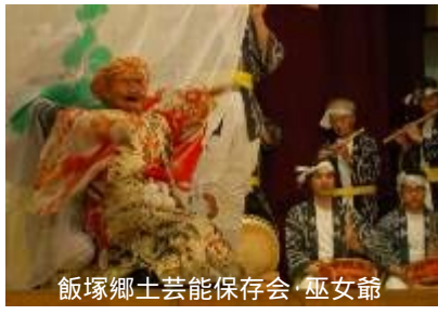
飯塚郷土芸能保存会 巫女節