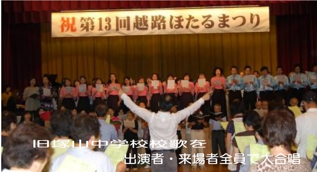
旧塚山中学校校歌を 出演者・来場者全員で大合唱

6月26日(土)に塚山南部地域体育センターにてほたるまつりが開催されました。あいにくの雨模様にもかかわらず、来場者は4,000人。