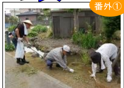
ホタルロード維持管理組合の人々がキャンドルナイト実施に向け、周辺の清掃を行いました(6月13日)

地元の方々と越路・まちみらい工房のメンバーが5月中旬に放流したホタルの幼虫が飛ぶかも?!とドキドキしながら当日を迎えましたが、ホタルを2匹発見!!このホタルが産卵し、来年はもっとたくさんのホタルが現れてくれたら!とさらに期待が高まりました。