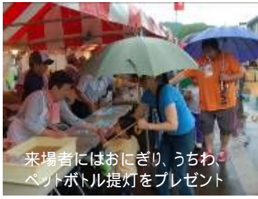
来場者にはおにぎり、うちわ、ペットボトル提灯をプレゼント