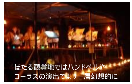
ほたる観賞地ではハンドベルやコーラスの演出でより一層幻想的に