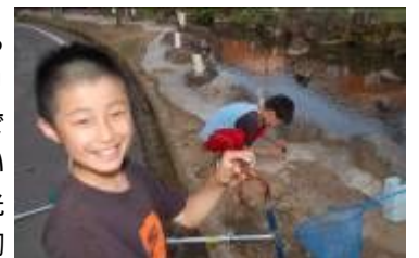
ザリガニとりを楽しむ子どもたち