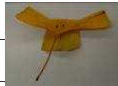
ゾウ(イチョウの葉)