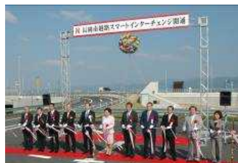
開通式で行われたテープカットの様子

9月24日に開通した長岡南越路スマートインターチェンジ。産業や観光への波及効果が期待されています。