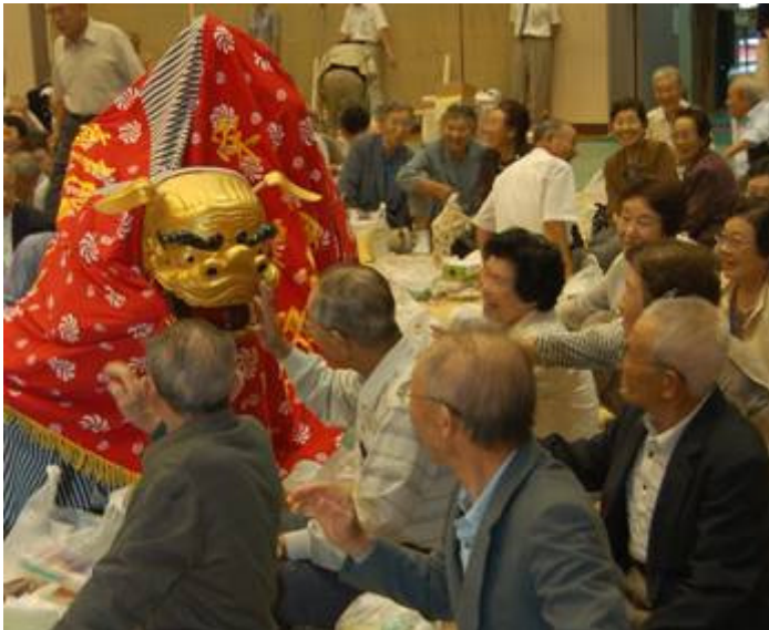
越路地域の74歳以上の人口は2,359人。