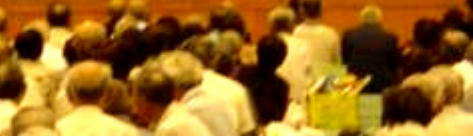
↑毎年大人気。保育園のお遊戯。