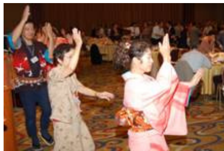
全員で輪になって踊る越路盆唄。