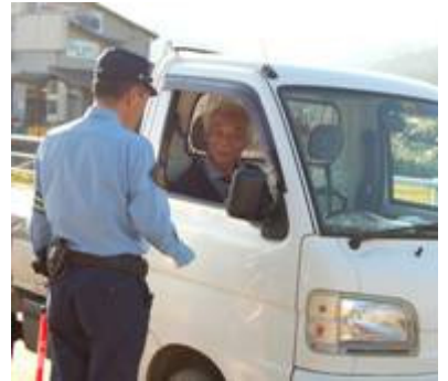
安全運転を呼びかけました。 （9月21日 飯塚）