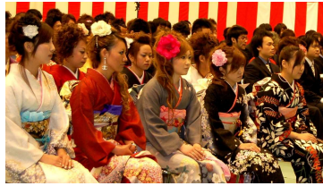
昨年の成人式の様子

出席される方は、忘れずに申込書を長岡市教育委員会越路分室まで提出してください。(申込書は3月末に送付してあります。)