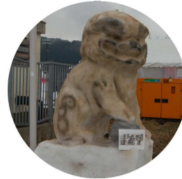
銅賞 「こまいぬ」 JA 越後さんとう A