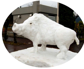
銀賞 「猪」 元町 B チーム