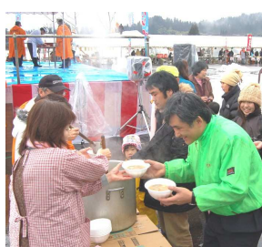
↑ あんこう鍋で「あったまる~」