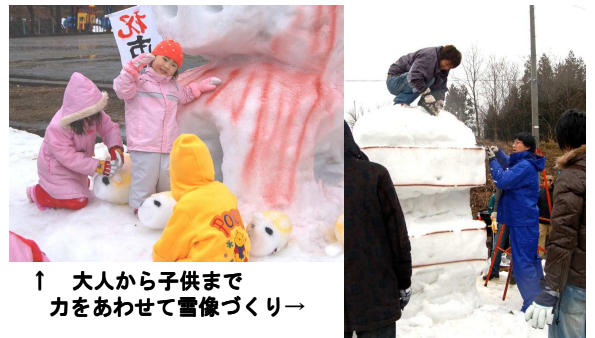
↑ 大人から子供まで力をあわせて雪像づくり