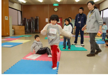
「やったあ」ゴールへ一直線

「あっ！ここに行ったことがあるよ（杜々の森名水公園）」という子や、サイコロの目が合わずに、目の前のゴールになかなか辿りつけない子など、サイコロを振るたびに子供たちの歓声があがっていました。