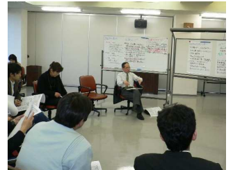
さまざまな意見が飛び交う委員会の様子