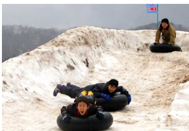
↑ スピード感がたまらない雪山すべり台