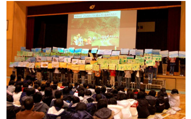
観察に行った時の様子を絵で再現した越路小学校

子供たちの発表に、地域でホタルの保護活動をしている男性は、「ホタルのことをよく調べてあって感心した。これからはホタルの住む環境を大事にして欲しい。」と話していました。