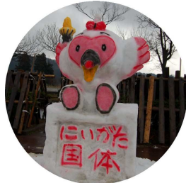
銅賞 「トッキッキ」 チームとっておきの長岡