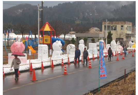
↑ 力作がずらりと並んだ会場入口