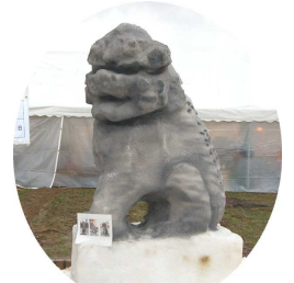
銅賞 「こまいぬ」 JA 越後さんとう B