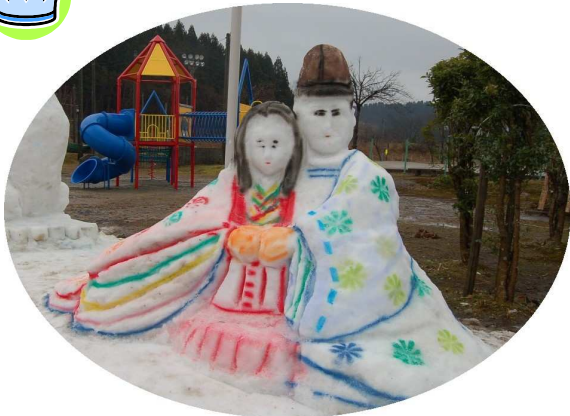
金賞 「源氏物語」 元町 A チーム