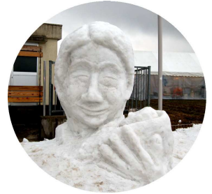
銀賞 「命」 十楽寺子供会