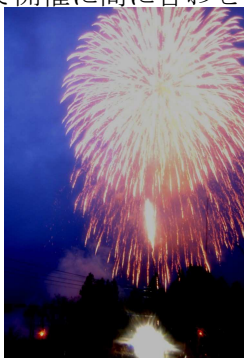
冬の澄んだ空気に花火が映えます。

クライマックスは恒例の花火打ち上げ。夏とはまた一味違った冬の花火の美しさに訪れた人たちは寒さを忘れてじっと見つめていました。