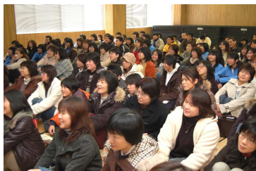
サイパンの楽しそうな様子に思わず笑顔

また感想発表では研修で班長を務めた7人により順番に発表。「ラストコマンドポストが印象に残りました。戦争のない世の中になって欲しい。」「英語が伝わってうれしかった。研修で学んだことをこれからの生活に活かしていきたい。」と思いを語りました。