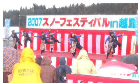
雨の中 ソーラン踊りで盛り上げます。 ↑ (越路メチャイケ隊)