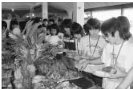
熱帯植物園でフルーツの食事会