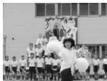
生徒の成長を促す感動の体育祭

生徒会自身の手で創り上げた、塚中三つの心。この歴史をさかのぼると、平成八年に「いじめを出さない」ために、具体的な実践に取り向くことの提案がなされています。 掲げられているのは、「助け合いの心」「思いやりの心」「信じ合う心」の三つです。今も生徒会長の所信表明で、「あいさつ日本一の学校にしよう」と呼びかけられます。異学年男女など関係なく誰とでも心から挨拶を交わし合うことで信頼が一層強まり、三つの心が自然に浸透しています。