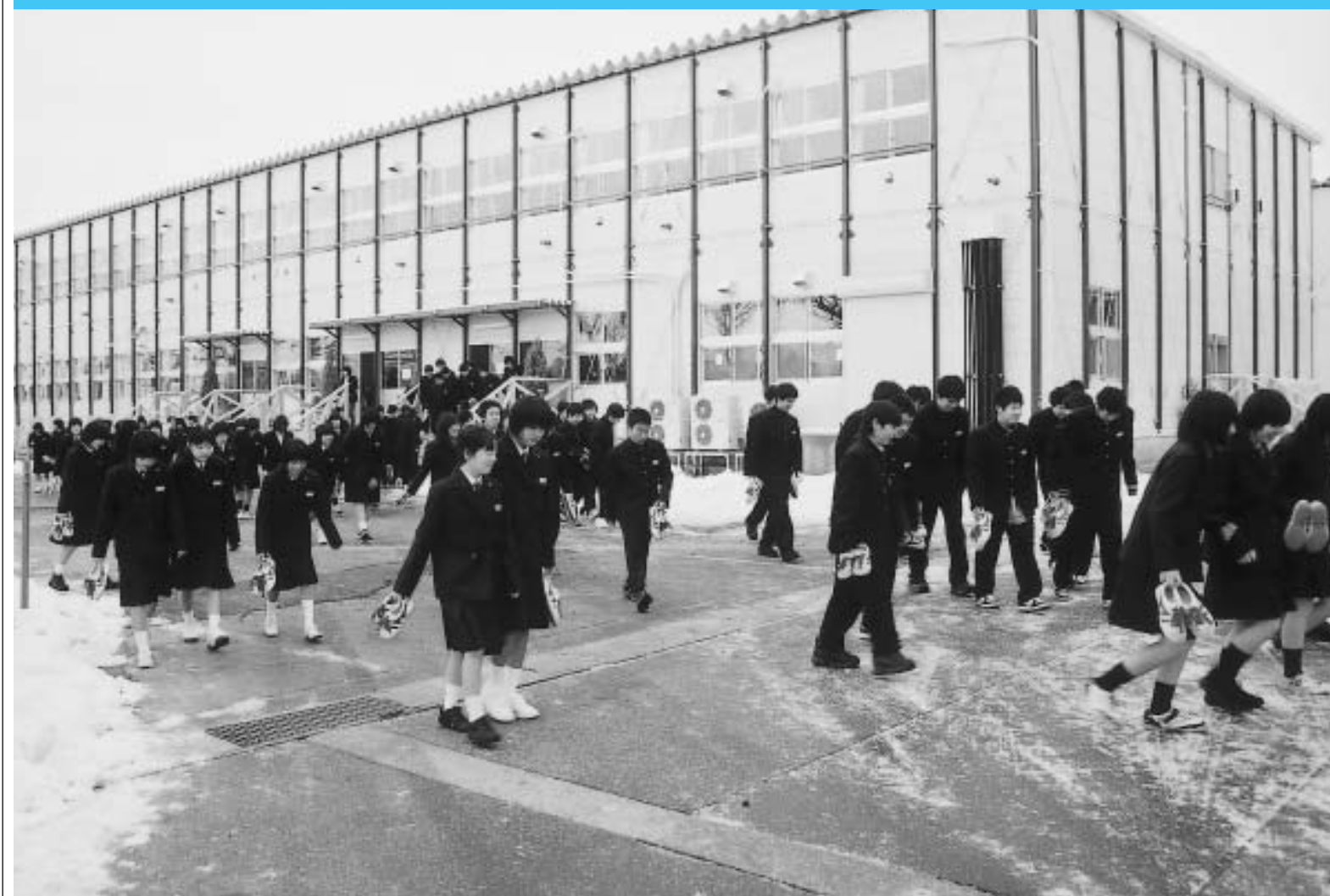
町民体育館駐車場に造られたプレハブの仮設校舎で 3学期がスタートした越路中学校 1月6日