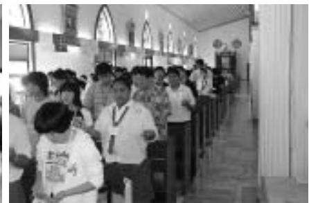
教会(マウントカーメル学校内)でのお祈り