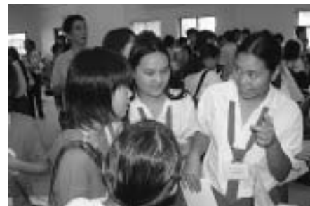
マウントカーメル学校事前訪問で名刺交換