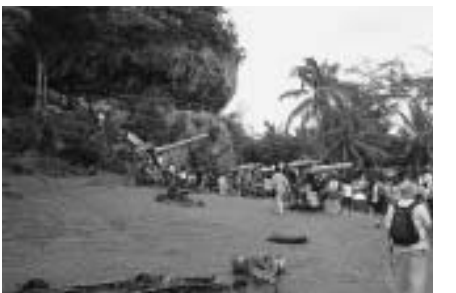
ラスト・コマンド・ポストを訪れて

2日目は、午前中の時間を使って見学に行きました。行ったところは、ラストコマンドポストやバードアイランド、スーサイドクリフなどを見学に行きました。僕が一番、目に焼き付いた場所はスーサイドクリフでした。その理由は日本兵がアメリカ兵に追いつめられて身を投げ出すという話を聞いたからです。今では、日本とサイパンはとても平和だけど、昔はサイパンでも激しい戦争が起きていたということをサイパンの所々にある戦争の跡を見て知りました。