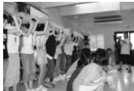
交流会での越路中学校の出し物のようす