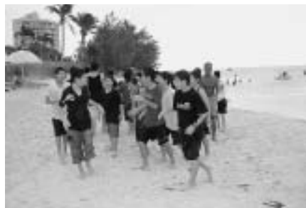
ホテル前のビーチで海水浴

サイパンに到着してから1日目は主に行事はなかつたけど、初めてサイパンの料理を食べ、それからはホテル内で友達とトランプをして楽しく遊びました。