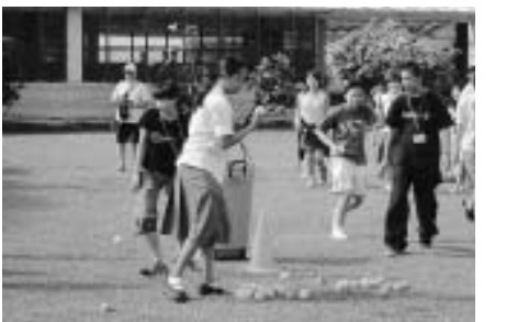
スポーツ交流会でも汗が出ました