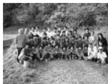
浜海はたるの会に協力・カワニナ集め

の気持ちではなく、一生懸命準備してくれた友を思う気持ち、自分たちの力で成功させようという気持ちを支えようという気持ちを感じ取ることが出来ます。行事の毎に生徒の成長を確認することができます。