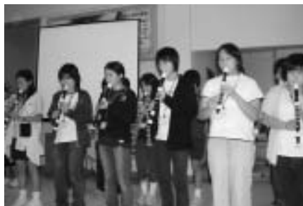
交流会での塚山中学校の出し物のようす

僕は、この研修に行くのに3つの目的を持って行きました。一つ目は、集団行動に必要な知識や技術を知つたり、身につけるため。二つ目は、