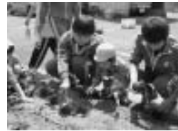
心が育つ花づくり

生徒が中心となって、植栽活動の核となる夢花壇や学年花壇の設計から、花の選定、水やり、草取り等の運営を考えます。種から花を育てたり、五月には地域の老人クラブの方々と約二種類千五百株の苗を植えました。手をかければ手をかけるほど美しい花を咲かせてくれることを知っている生徒は、汗と土にまみれながら黙々と活動を行います。