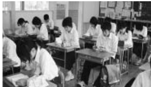
本を読みながら 自分と向き合う大切な時間

毎朝全校一斉に10分間の読書を行っています。生徒は各自が用意した本を教室で読みますが、10分間の僅かな時間ですが、毎日続けることで成果が上がっています。