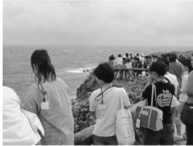
バンザイクリフを訪れて

参加者とその保護者を対象に2月には報告会も予定しています。参加者の感想文の一部を紹介します。