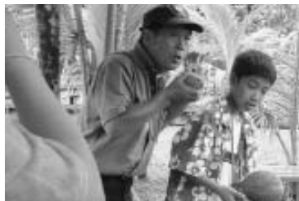
熱帯植物園でこれからヤシの実を料理

が、スタッフの方達がビデオを見せてくれたりと気をつかってもらったりしてありがたかったです。もう一つ交通面であった飛行機は2度目だったので、そんなに心配はありませんでした。窓からの景色がとてもきれいでした。