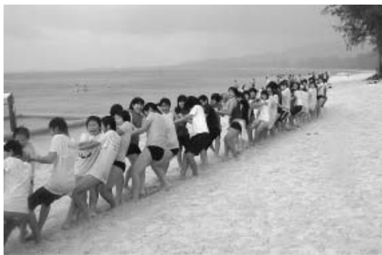
ホテル前のビーチで、いつのまにか男女対抗の綱引きで盛り上がりました

英語の授業で習ったことを発揮するため。三つ目は、楽しい思い出をつくるため。という3つの目的を持って行きました。