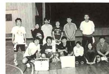
▲ニューヤンキースA