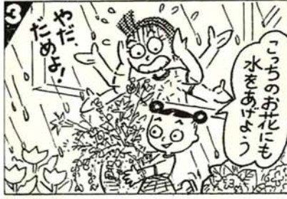
ここのお花にも 水をあげよう。