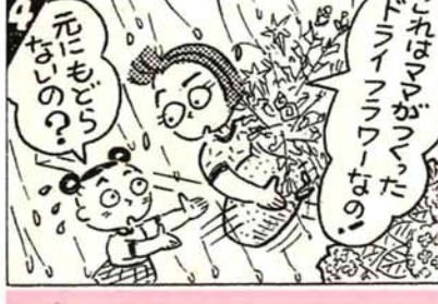
これはママがついた ドリンマワワーだね。 元にもう？