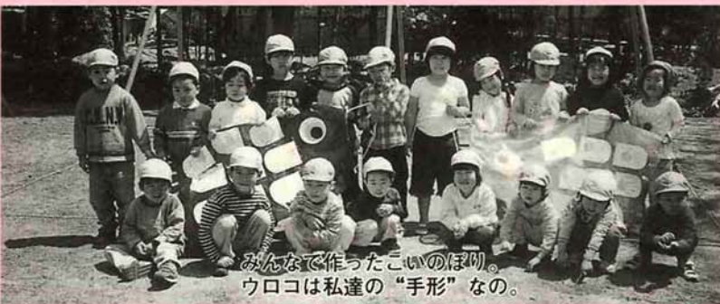
みんなで作ったこいのぼり。 ウロコは私達の“手形”なの。