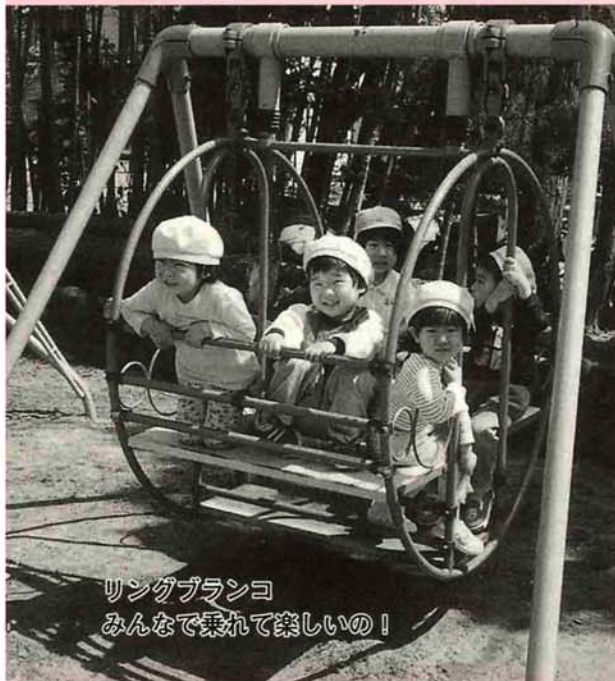
リングブランコ みんなで乗って楽しいの！