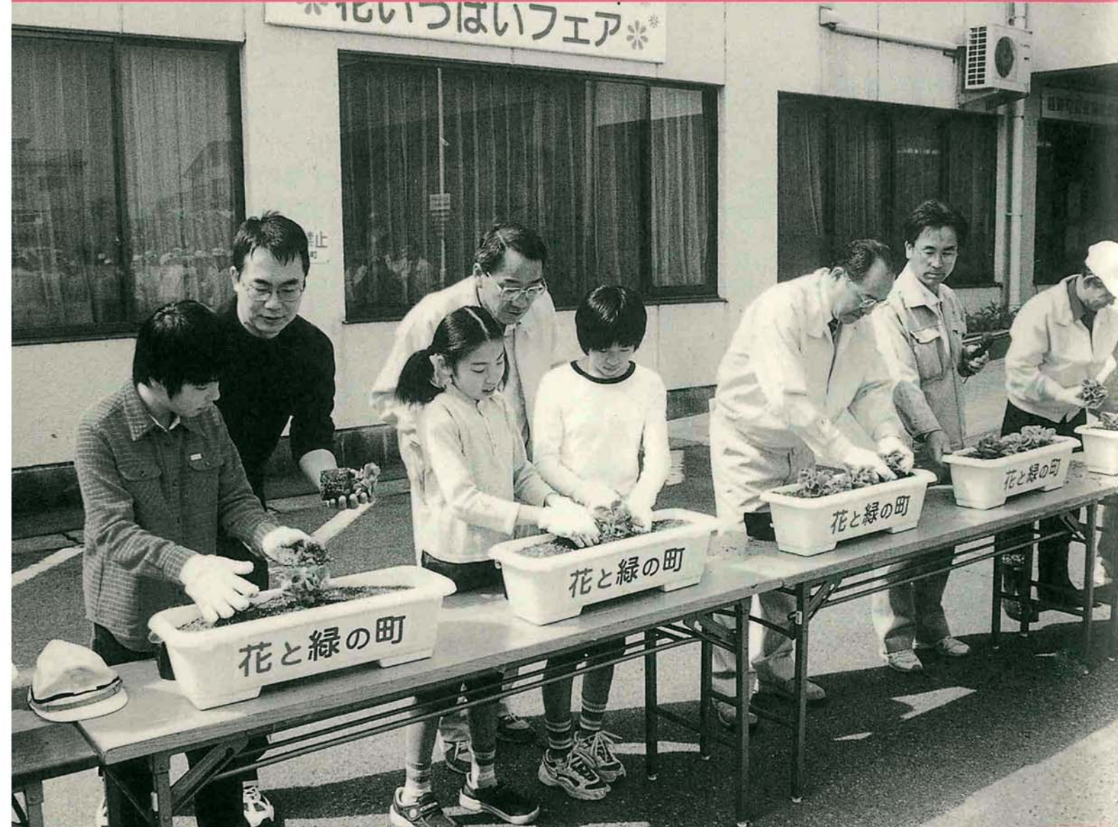
みどりの日に行われた花いっぱいフェア 福祉センター