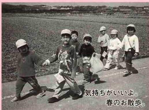
気持ちがいいよ。 春のお散歩。