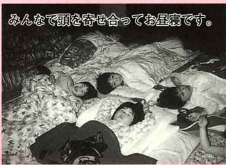
みんなで頭を寄せ合ってお昼寝です。