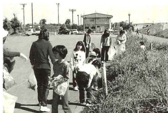
浦婦人会と子ども会による空き缶拾い（5月12日 河川公園内）