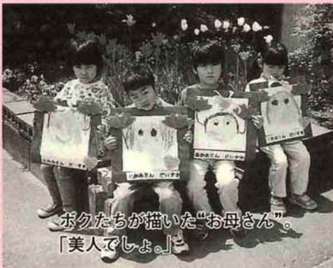
ボクたちが描いた“お母さん” 「美人でしょ。」