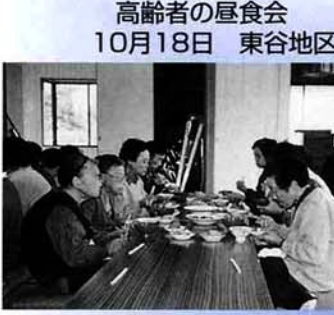
高年齢者の昼食会 10月18日 東谷地区

元気な生活を送っていただきたいと高齢者を対象に東谷集落センターで昼食会を実施しました。 昨年引き続き「カルシウムを摂って強い骨づくりのお手伝い」をさせていただこうと献立の中に貝たくさんで牛乳入りの味噌汁も用意させていただきました。