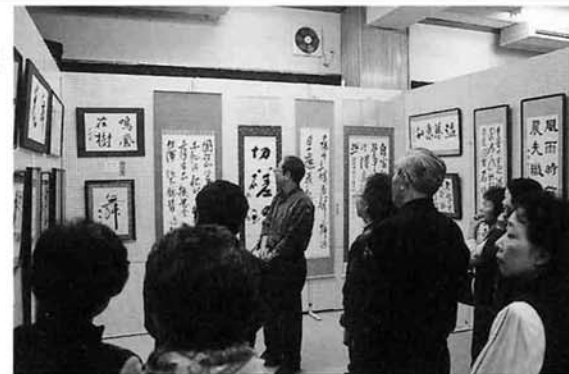
▲関大撰先生による作品講評 (福祉センター3F)