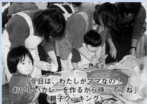
「今日は、わたしがママなの!」 おいしいカレーを作るから待っててね (親子クッキング)