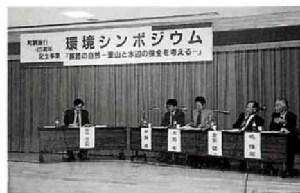
パネルディスカッションの様

十一月五日(日)町保健センター前で素人によるそば打ち大会が行われました。今回は、そば作り愛好家五組が集い、そば打ちの技を競い、できあがったそばの味を楽しみました。大会で作ったそばと販売用のものを合わせ一般の方々からもご賞味いただき大好評でした。