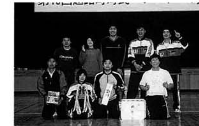
▲浦中ファミリーズA