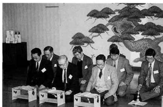
▶浦澤陽会の方々による「高砂」の発表 (浦区事務所)

十一月十九日(日)、浦区事務所において、平成十二年度越路町謡曲発表大会が行われました。「鶴亀」、「羽衣」、「班女」など、名曲の数々を来迎寺、浦、塚野山そして片貝の各団体の方々が発表されました。また、「紅葉狩」、「雲林院」などの曲目では、衣装を身に付けた越路会の皆さんが仕舞も披露され、幽玄の美を表現されていました。