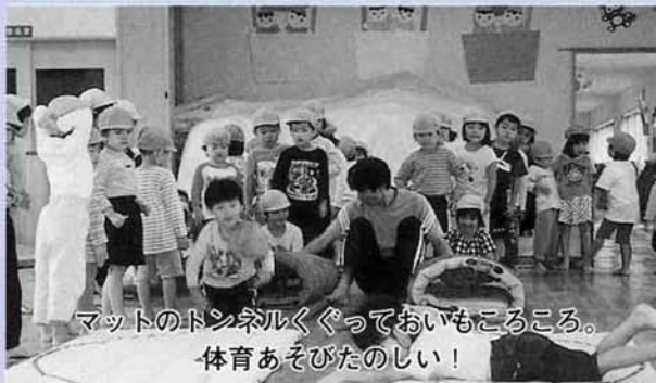
マットのトンネルくぐっておいもころころ。 体育あそびたのしい!