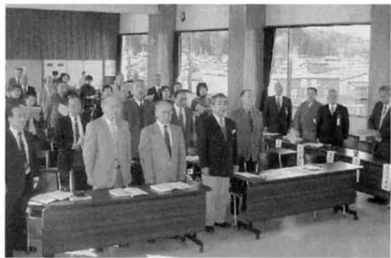
▲参加者全員による大合吟 (福祉センター3F)

町民の部(飛び入り)の発表があり、午後からは八段、神号へとより高段の方の発表が続きました。さらに総元代範による模範吟詠もあり、素晴らしい喉を披露していただきました。