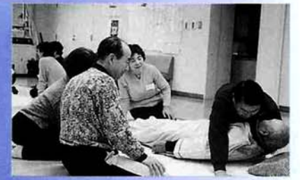
寝たきりになると体が重くて、ヨイショ!!

11月15日、社会福祉協議会主催の介護講座が28人の参加で行われました。家庭でお年寄りのお世話が必要になったとき、困らないために皆さん熱心に1日、講義や実習に取り組みました。