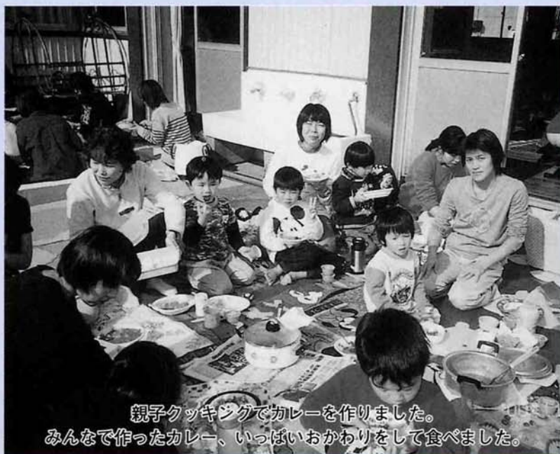
親子クッキングでカレーを作りました。 みんなで作ったカレー、いっぱいおかわりをして食べました。