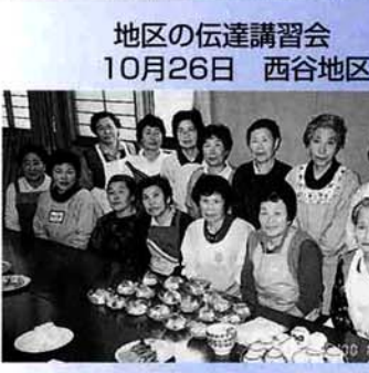
越路町の食推研修会で学習した調理実習を地域の方と一緒に調理実習をしました。試食をしながら日常の食生活談義に話がはずみました。