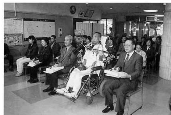
▲町美術展表彰式 (保健センター1Fロビー)

審査対象となる四部門では、絵画の部四十二点、書道の部五十三点、陶芸の部三十一点、写真の部三十三点、と昨年を上回る数の作品が展示され、また作品の質も高いものとなりました。