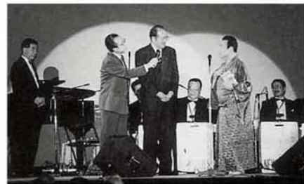
町長から完成したばかりの昔ばなしのビデオが渡されました