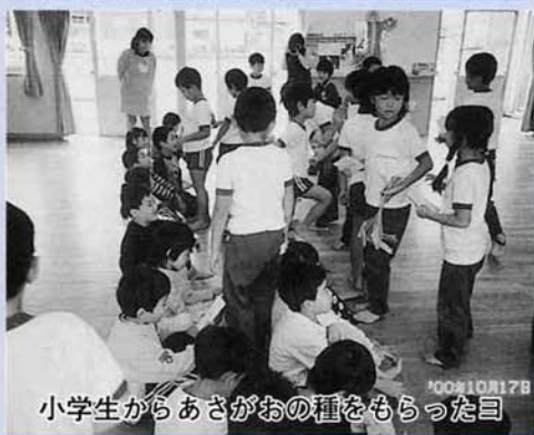
小学生からあさがおの種をもらった日