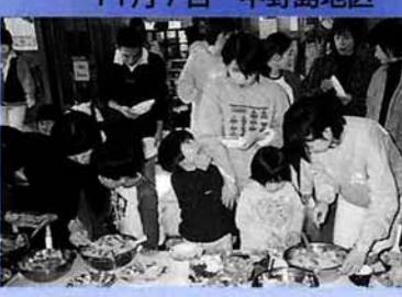
「食生活をもう一度見直してみよう」というテーマで中野島保育園の園児と保護者を対象に講話と試食会を開催しました。