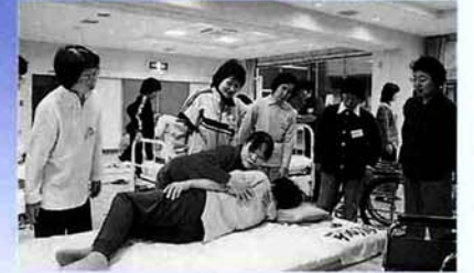
寝返りはこうやって横向きにしてやさしく声をかけて…。