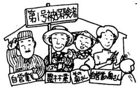
20歳以上60歳未満の自営業者等

「国民年金保険料の納付時効は二年」皆さんの中で、過去に納め忘れの保険料のある方は、早めに納めてください。国民年金保険料は、法律で二年を経過すると納めることができなくなりま