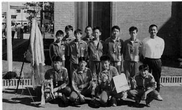
12年ぶり総合優勝の塚中チーム