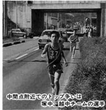
中間点附近でのトップ争いは 塚中、越中チームの選手

結果は、塚山中が12年ぶりの総合優勝を飾りました。又中学生女子も塚山中が初優勝に輝きました。