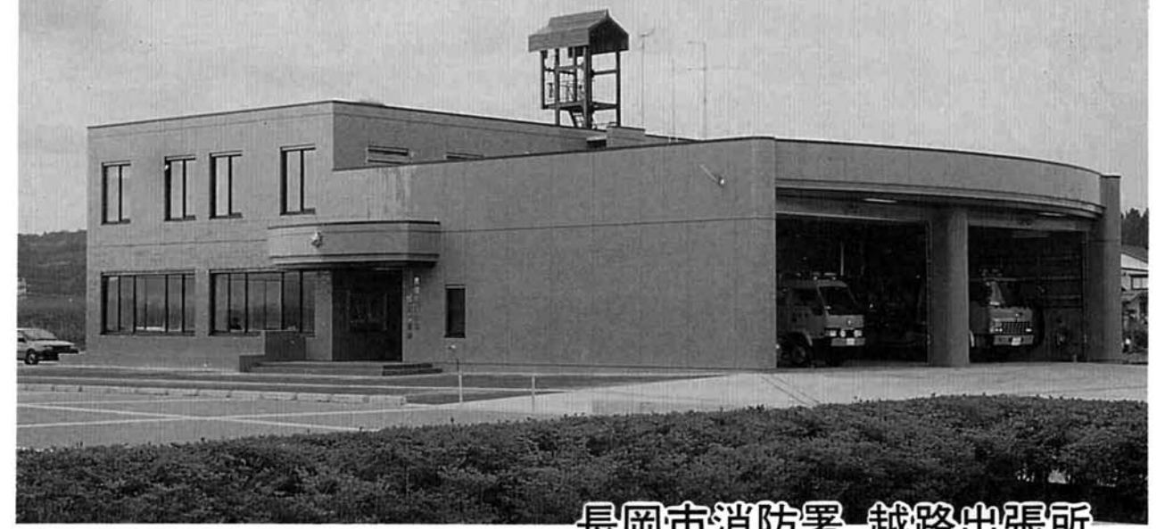
長岡市消防署 越路出張所

平成元年十月一日から長岡市消防署越路出張所が業務を開始いたしました。私たち越路町の消防は、今まで非常勤の消防団員により非常時に備えてきましたが、近代建築物の増加や交通量の増大など急速な町の都市化により消防業務も複雑多様化しており、高度な専門知識や技術を求められてきました。 これ等に対処するため消防の常備化が急務とされ、このたび長岡市のご理解により広域的常備消防が委託方式により進められることになりました。