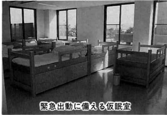
緊急出動に備える仮眠室