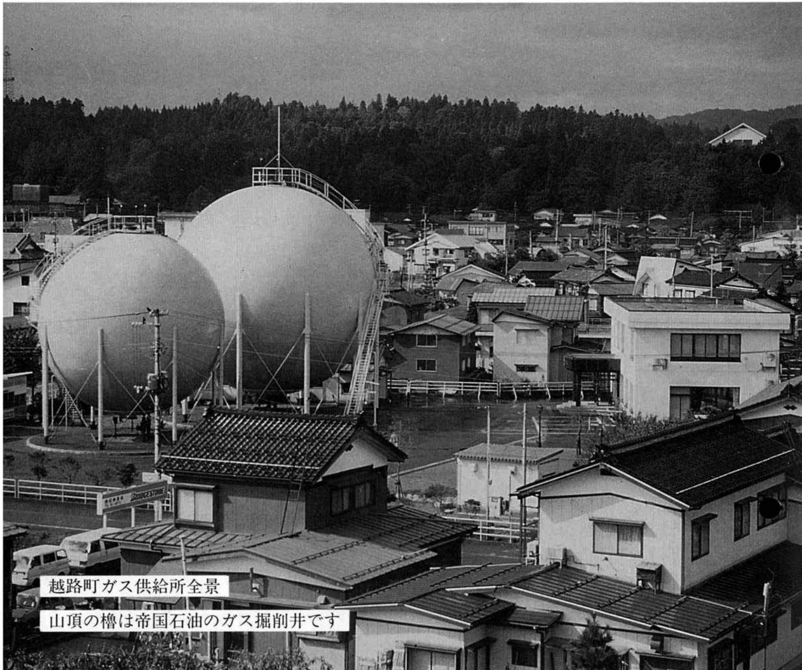
越路町ガス供給所全景 山頂の槽は帝国石油のガス掘削井です

■ 発行 / 越路町役場 (新潟県三島郡越路町) TEL (0258) 92-3111 ■ 印刷 / 大川印刷株式会社