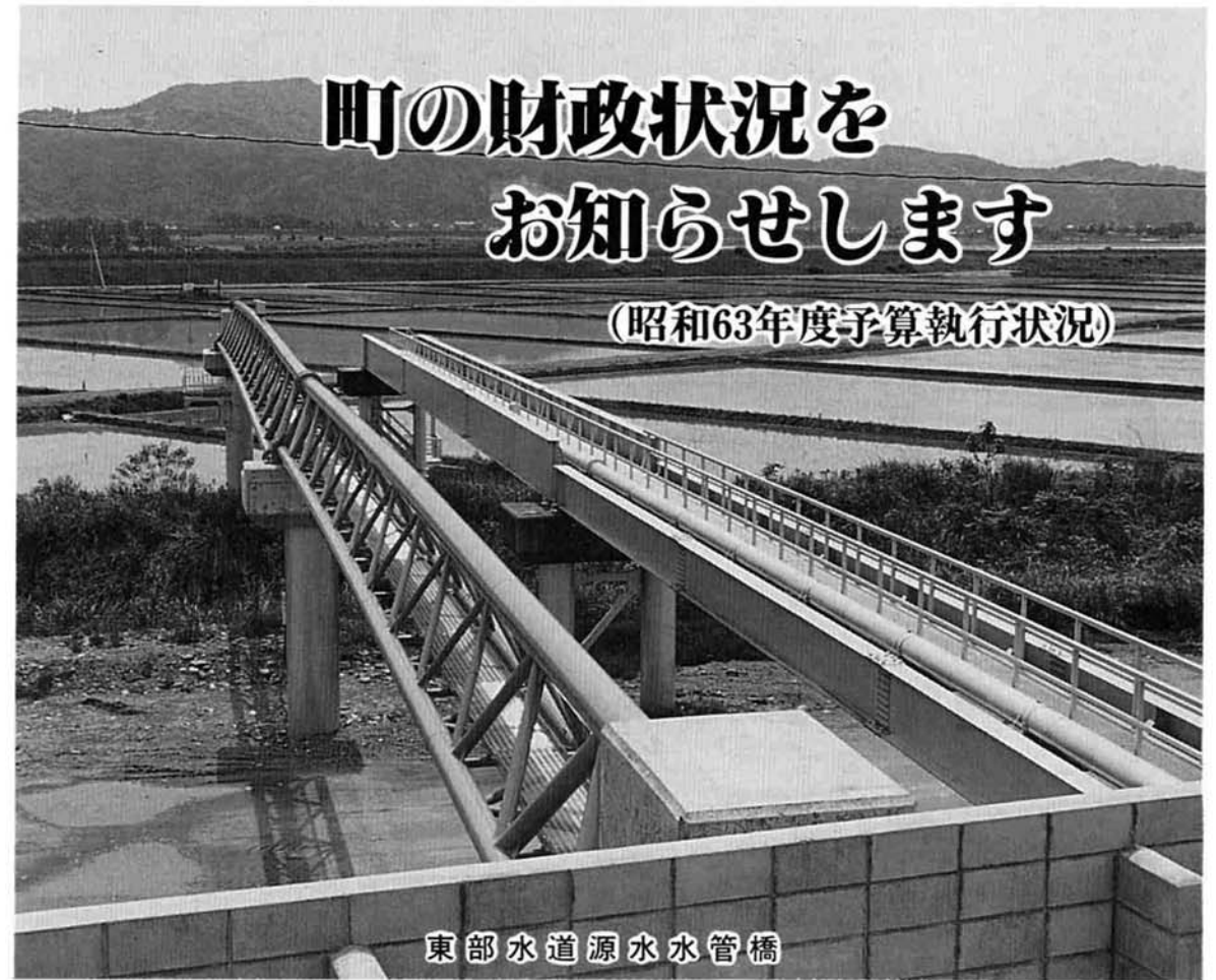
東部水道源水水管橋

越路町の財政がどのように運営されているか、町民のみなさんに知っていただくために、昭和六十三年度下半期の 財政状況をお知らせします。 昭和六十三年年度一般会計は当初予算額三十七億九千万円でありましたが、その後五回