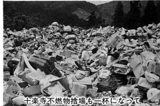
十楽寺不燃物捨て場も一杯になって

一、ゴミは指定日の朝八時までに出す。ゴミ収集は朝八時頃から開始します。ですから遅く出されると、収集されないことがあります。指定日以外には出さないようにお互いに注意しあってください。ゴミ収集場所は「ゴミ捨て場」ではありません。二、生ゴミは水切りを良くする。台所から出されるゴミは、水分の多い燃えにくいものも多く出されます。特にこれから夏に向け水分の多い食べ物が多くなります。出す前に水切りを良くしてください。三、皆さんに協力していただきたいこと。木くず、庭木等は五〇センチ位に切りきざみ、小さくしつかり束ねること。耕耘機やコンバインなど大型のものは収集できません。大型の家具や農機具・電化製品などは、買い替える時業者に引き取ってもらってください。資源として利用できる新聞紙やビン類は廃品回収へ。