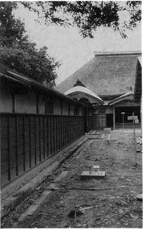
▲この塀の下にも大きな地中梁が施工されています

庭塀・裏門の復元や、堀・庭の整備と各建物の防災工事をいう予定になっております。これらが終る今年秋には、修復なった長谷川邸と敷地内に昨年暮れ完成した越路町観光センターの同時開放が計画されており、町民はもとより広く県内外の皆さんに一般公開されることとなります。