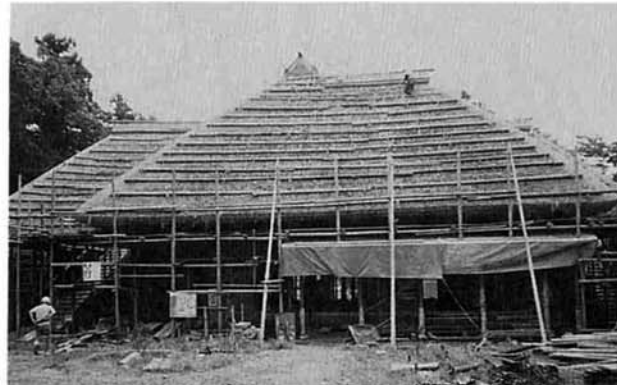
▲昭和62年9月茅葺が終り上棟式を行う

国指定の重要文化財長谷川邸の修復工事が最後の仕上げ段階に入っております。昭和五十七年国の重要文化財として指定をうけて以来、一時町民に公開を行ないましたが、昭和五十九年から大規模な修復工事に入り今年秋完工の運びとなりました。この間延べ六十ヶ月の期間と、延べ約一万四千人の労力