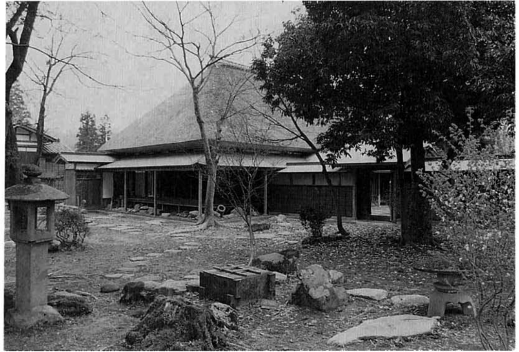
平成元年4月最後の修復工事に入った長谷川邸

国指定の重要文化財長谷川邸の修復工事が最後の仕上げ段階に入っております。昭和五十七年国の重要文化財として指定をうけて以来、一時町民に公開を行ないましたが、昭和五十九年から大規模な修復工事に入り今年秋完工の運びとなりました。この間延べ六十ヶ月の期間と、延べ約一万四千人の労力