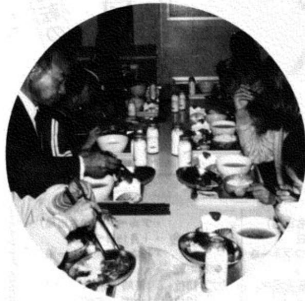
▲自分で作った茶わんで食べる味も格別！校長先生を囲んで、おいしく楽しいランチタイム

木沢小学校の食堂から「わあー」とひとときわ高い歓声が上がり、「いただきます」の元気の良い声がかきこえてきました。なにしろ今日は、自分の手で作った茶わんで給食を食べる日だから。 手づくり茶わんは大きいのもあれば、小さいのもあり、ゆがんだり絵柄もまちまち、だが、味はかくべつによいとか。