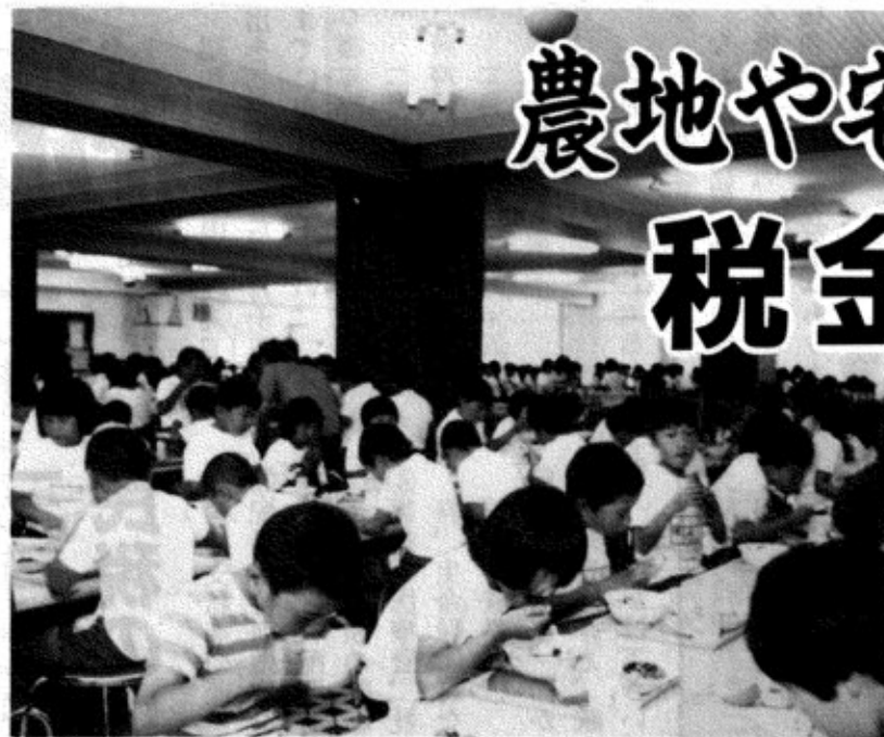
▲ 私たちが納める税は道路、下水道、学校、公園などの公共施設や教育、社会福祉、消防などの公共サービスの大切な財源として使われます。