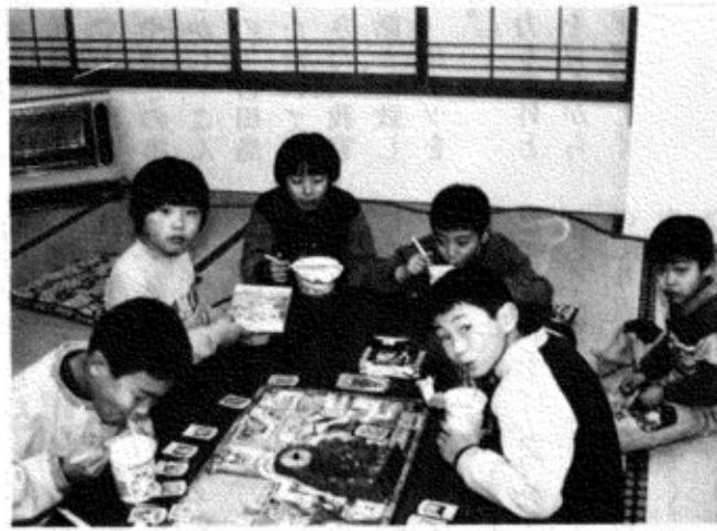
こちらはカップラーメンで夕食、ゲームをしながら…… (東部福祉センターで)