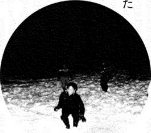
西川口の子供たち [中新田集会所で]