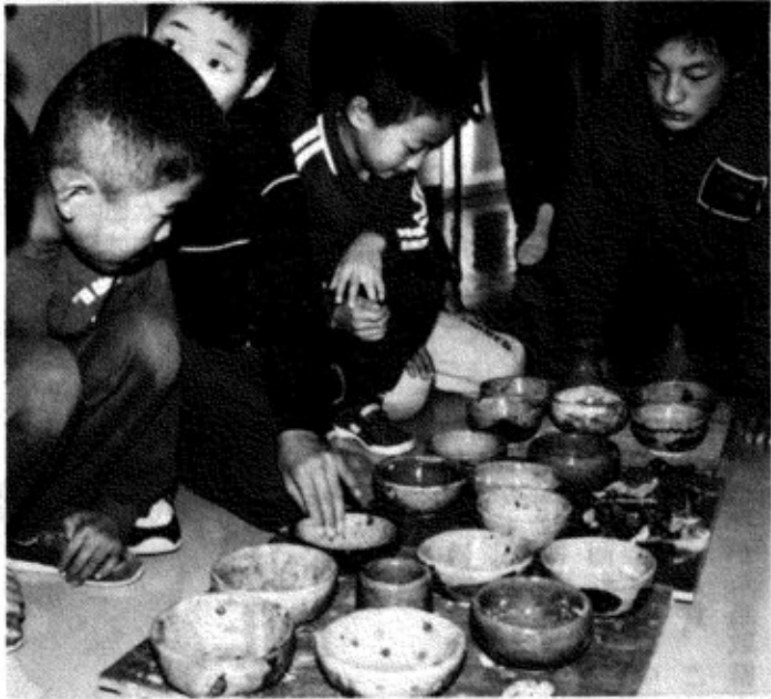
▲チャレンジ……土をこね形づくり……窯焼きまで1カ月の工程、焼き上がった茶わんでのきばえを真剣な表情で見入る木沢小の子どもたち。

お 願 い 住民税巡回相談期間中、二月十六日～三月六日までは財政課の職員は各地に出かけております。 都合で当日会場へこれられない方は、二月二十九日(月)町の商工会館又は、三月六日(日)の福祉センターへおいで下さい。