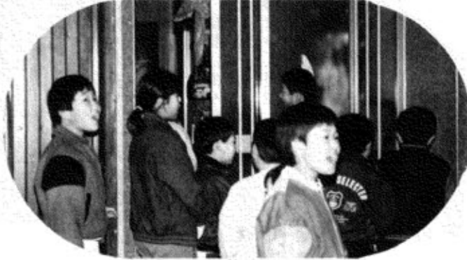
鳥追いの歌をうたいながら一軒一軒回る東部の子供たち

正月十四日の晩、子供たちは、農村行事の一つである、鳥追いの歌をうたいながら、一軒一軒回り、今年の豊作を祈り、作物を荒らす鳥を追い払いました。 子供たちが、楽しみにしていたかまくらは、少雪のため作ることができませんでした。子供たちは、家の中で(公民館で)モチを焼いて食べ、