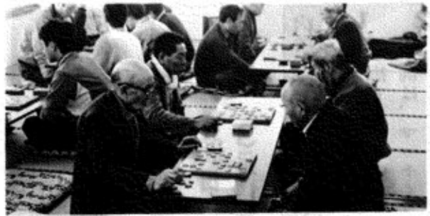
▲ 碁はA・Bに、将棋は松・竹組にわかれて、終日熱戦が繰り広げられた。1/17日 福祉センターで