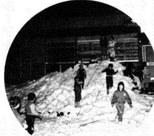
モチが焼けるまで!? 外で雪遊び、元気いっぱい