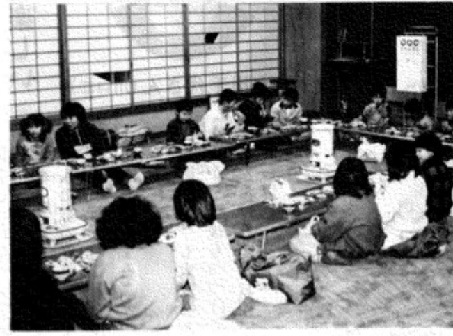
集合、机に菓子やモチを持ちよってみんななかよく (田麦山生活改善センターで)