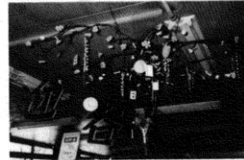
▲今はあまり見かけない「まゆ玉飾り」

古式豊かに職員の手造りで小正月行事の一つ、まゆ玉、稲穂を飾り、豊稔を願う、「まゆ玉飾り」が川口郵便局で行われた。古い行事を知ってもらおうと、又、今年完成の新局舎への期待を込めて飾られたもので、訪れた人たちの好感を呼んでいた。(写真)