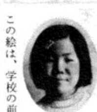
この絵は、学校の前のおかの上から見てかいた絵です。

すぎの木は、もつと後の方にあったのですが、かいたら近くになってしまいました。 草や、いたの色をかえたりしてぬったのでよかったです。 めんどろがらないで、もつとていねいよればよかったです。