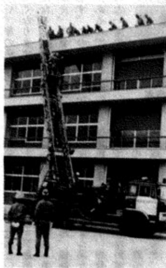
ハシゴ車による救出訓練

川口町消防団の総合演習は、二百七十人の団員を集めて、先月二日川口中学校で行われました。