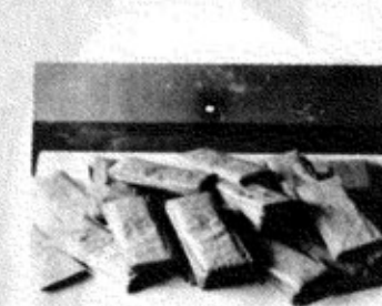
小学生が書いた手紙の山

敬老の日、今年もおとしよりのところへ、小学生から心のこもってお便りがとどきました。 川口小学校児童会が、自主的な活動として数年前から始め、学区内の六十才以上のおとしよりへ、全部の生徒で書いて出しているものです。 字のまちがいや文はへたでも、