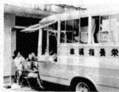
キッチンカーによる栄養指導

血液の中の赤血球の数や、赤血球に含まれている色素の量が少なくなつた状態「貧血」といいます。貧血は胃かいよう・じ・子宮筋腫などの病気によってもおきます