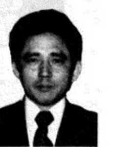
小高 農業 39才

原新田 会社役員 51才 ①町議二期、議長、監査委員、教育委員、社会教育委員、地区総代 ②明朗で心豊かな町づくり。 ③一、地方産業の育成と向上。二、生活環境の整備促進。三、学校及び社会教育の充実。