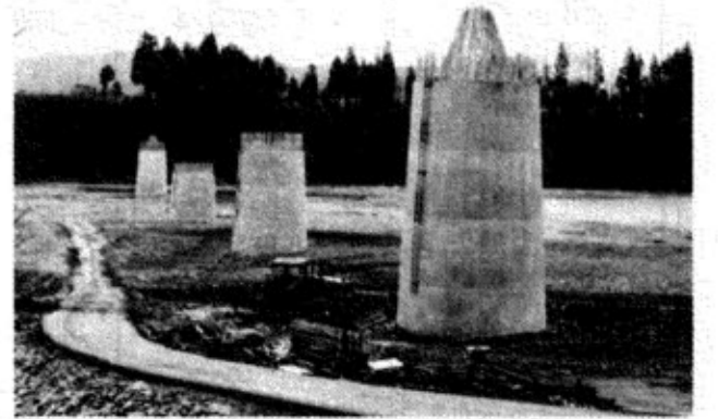
写真は信濃川にかかる川口橋の橋脚

関越高速道の川口町内における建設工事は、昨年秋から西倉と川岸の河川敷地内で、橋梁の下部工