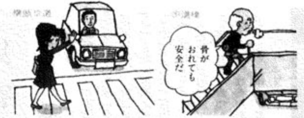
道路を渡るときが最も危険です。横断歩道や歩道橋を利用して安全に渡りましょう。

春の全国交通安全運動が、五月十一日から二十日までの十日間、全国いっせいに実施されます。今年の重点目標は、次の三点です。 交通事故死者のうち三人に一人が歩行者で、なかでも子供と老人の多いのが目立っています。また、自転車と原付自転車乗車中の死者も増加しており、歩行者を加えた「交通弱者」の死者は、全体の約半数を占めています。一方、死亡事故をドライバーの面からみると、酒酔い、無免許、スピード違反の「交通三悪」によるものが約三分の一になります。この運動を機会に、子供や老人のいる家庭では、事故防止について話し合いをしましょう。