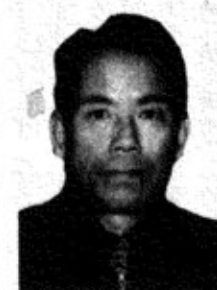
大谷内 農業 55才

①町議一期、商工会理事及監事、消防分団長、地区副総代 ②過去四年間の経験を生かし、財政健全化と、町民サービスに取り組む町政に、微力を尽くしたい。 ③和南津部落が直面している水路及び道路の整備。生活関連施設の整備。