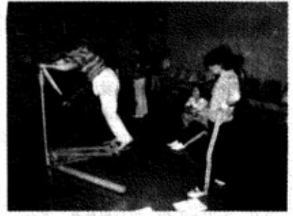
スキートレーナーエクセル

トリムボード・ローリングマシン ボートをこぐ要領で、体を前後に曲げて全身運動する。 腕、背、腹、脚の筋力を強化し、体力をつくります。 スキートレーナーエクセル 足・腰を中心に、スキーをする要領で美容、健康に役立ちます。興味性の高い運動器具で、あきがありません。