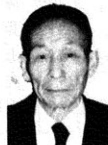
上河原 雑貨販売業 66才

①町議一期、農業委員三期、同会長、除雪組長十三年 ②話し合いを基本とする、明るい政治の実現。 ③地域の事態に即した農業の振興。高速道工事によって発生する農業及び生活環境悪化の防止。