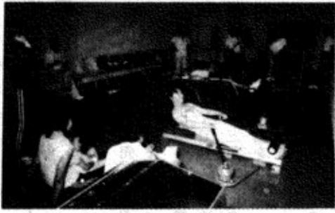
ローリングマシン