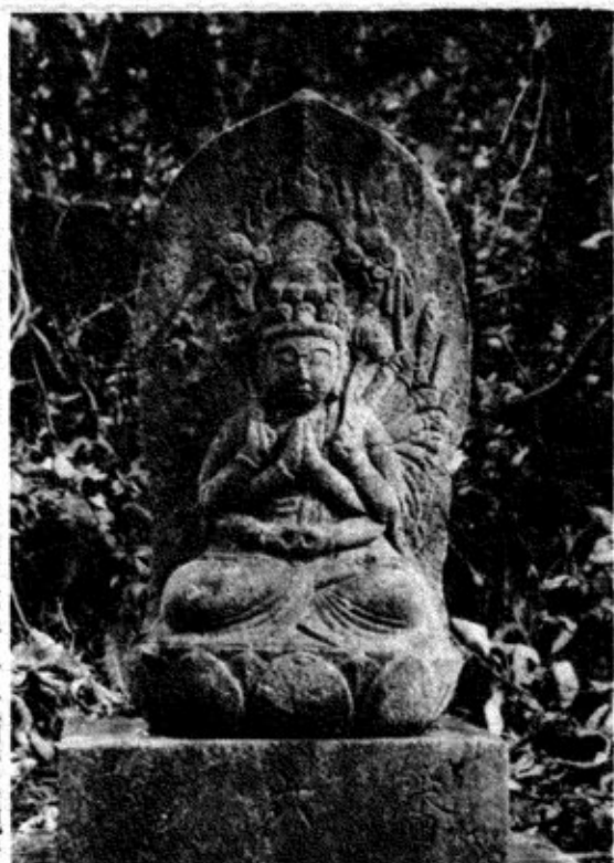
第六番十一面千手観音