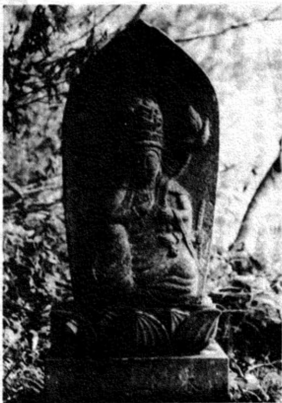
第一番如意輪観音