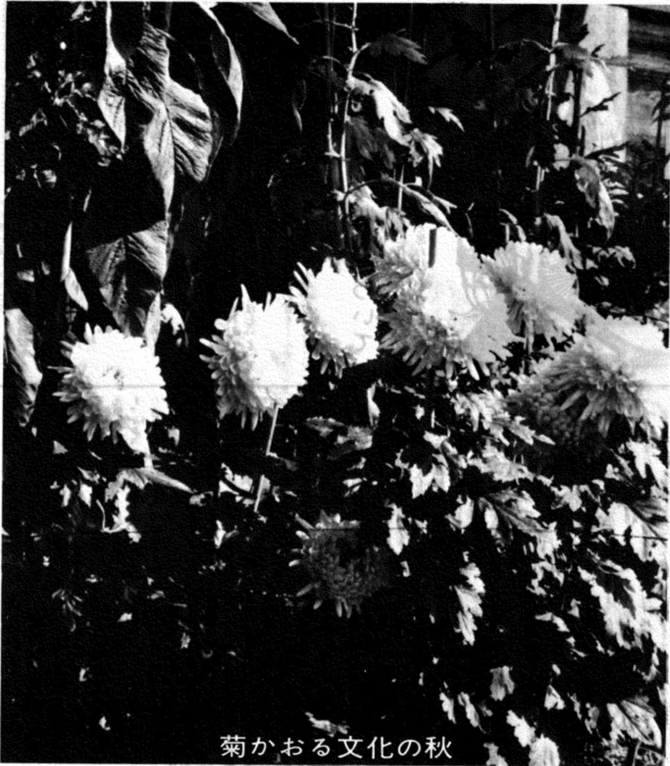
菊かおる文化の秋