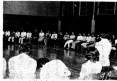
広神青年会とのたのしい交換

川口町青年団では、昨年の六月発足以来「青年の輪を広げ住みよい郷土を作ろう」を合言葉に、毎月の事業、青年のつどいを中心に活躍を続けています。これから毎回「広報かわぐち」を利用していただきまして私たちの活動ぶりを町民の皆様にも知ってもらおうことになりました。