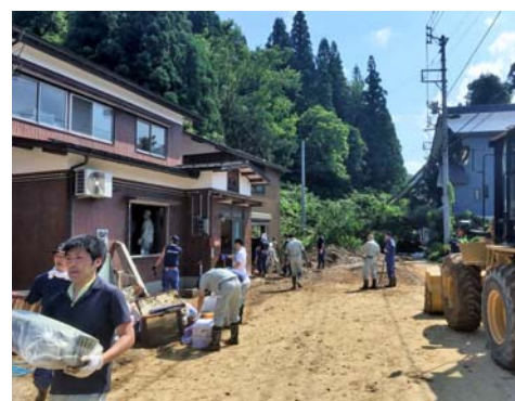
▲ 家屋の泥上げ作業や片づけを手伝う消防団など（西川口地区）