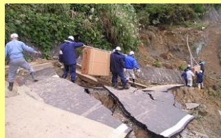
▲ 平成16年 中越地震発生後、人力で仮設トイレを運ぶ救援隊