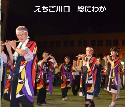
えちご川口 縋にわか