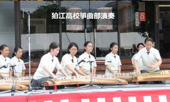
粕江高校箏曲部演奏