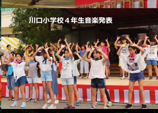
川口小学校4年生音楽発表