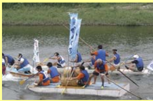
▲ 平成17年 狛江古代カップ多摩川いかだレースに参加

30年にわたって築き上げてきたかけがえのない友好の絆を大切に、今後も幅広い分野において交流を重ね、お互いを高めあいながら友好を深めていける関係を築いていきます。