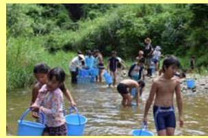
▲ 平成28年 ふるさと交流キャンプで川遊び