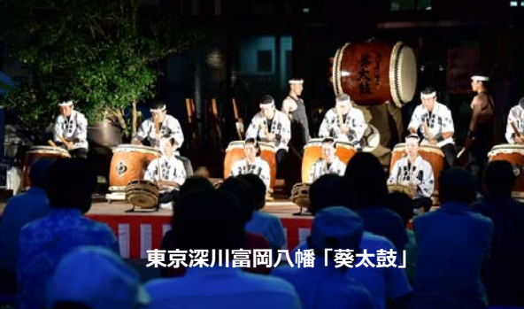
東京深川富岡八幡「葵太鼓」