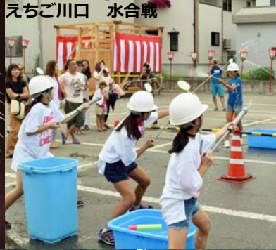
えちご川口 水合戦

7月29日、30日に夏の一大イベント川口まつりが開催され、2日間で25,000人を超える来場者で賑わいました。 川口中学校の生徒が扮する勇壮な武者行列や華やかにまちを練り歩く女みこしをはじめ、今年は粕江市との「ふるさと友好都市提携」が30周年を迎えることから粕江高校箏曲部の演奏が披露されるなど会場は盛り上がりました。 豪雨災害に見舞われた直後でしたが、元気いっぱいで大いに賑わいをみせた川口まつりとなりました。