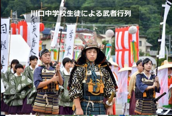
川口中学校生徒による武者行列