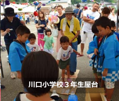
川口小学校3年生屋台