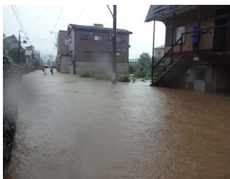
▲ 広範囲で冠水（東川口地区）