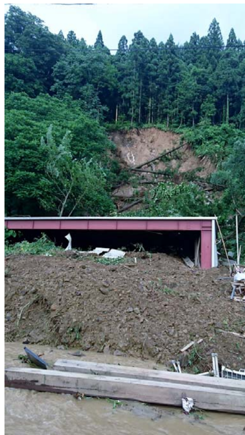
▲ 土砂崩れによる被害（東川口地区）