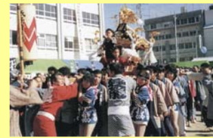
▲ 平成2年 狛江市内を女みこしが練り歩く

ふるさと友好都市提携書 自然のもつ豊かな恵みは人々の心に「うるおいとやすらぎ」をもたらします。 美しい自然に恵まれた川口町と豊かな自然を愛する狛江市は教育・文化・スポーツ・産業など幅広い分野において交流を行い、相互の発展と「ふるさと」と呼びあえる心ふれあう友好都市となることを提携いたします。