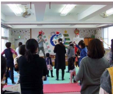
▲ すこやかクリスマス会

◆「豆まき」2日(木) 午前10時30分～10時45分 みんなの心こいる「泣き虫鬼」や「いやいや鬼」をやっつけましょう！鬼のお面も作ります。時間に余裕を持ってお越しください。