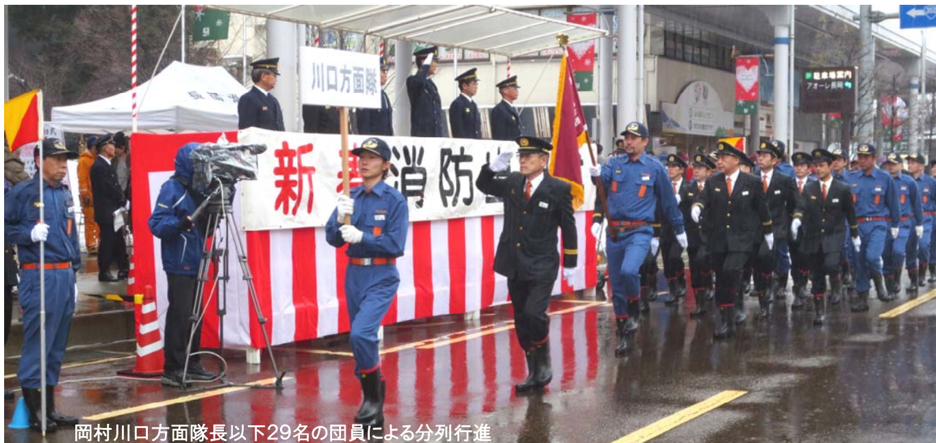
岡村川口方面隊長以下29名の団員による分列行進