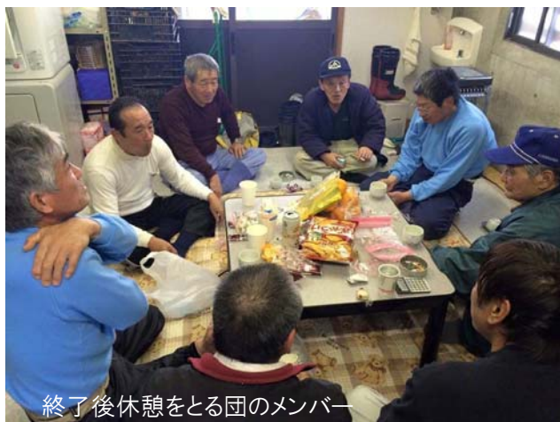
終了後休憩をとる団のメンバー