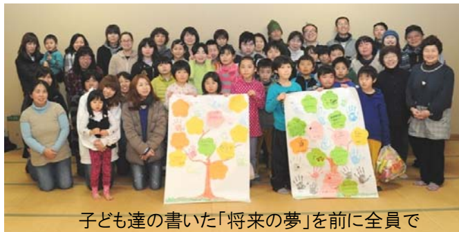
子ども達の書いた「将来の夢」を前に全員で

わくわく和南美と地区PTAが協力して小正月の行事鳥追いを行いました。途絶えていた伝統行事を復活して今年で4回目。夕方、集落センターに集まった子ども達など約40名は、蓑(みの)帽子をかぶり拍子木の音に合わせて鳥追いの唄を歌いながら地区内を回りました。