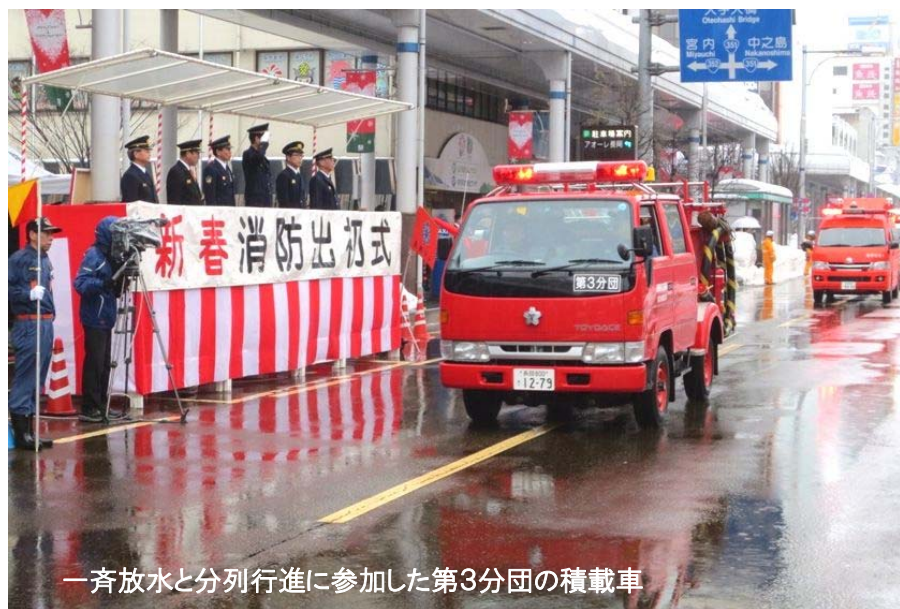
一斉放水と分列行進に参加した第3分団の積載車