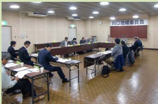
第2回地域委員会のようす