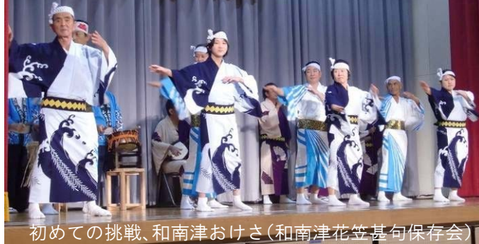
初めての挑戦、和南津おけさ(和南津花笠基句保存会)

11月1日から4日まで川口公民館において、文化祭が開催されました。保育園児から幅広い年齢層までの絵画や写真、陶芸、盆栽などすばらしい作品が並び、大勢の皆さんからご覧いただきました。