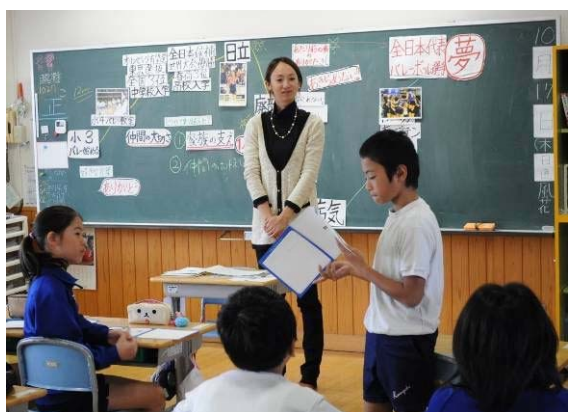
自分の夢を発表しました。未来のオリンピックメダリストも生まれるかも！