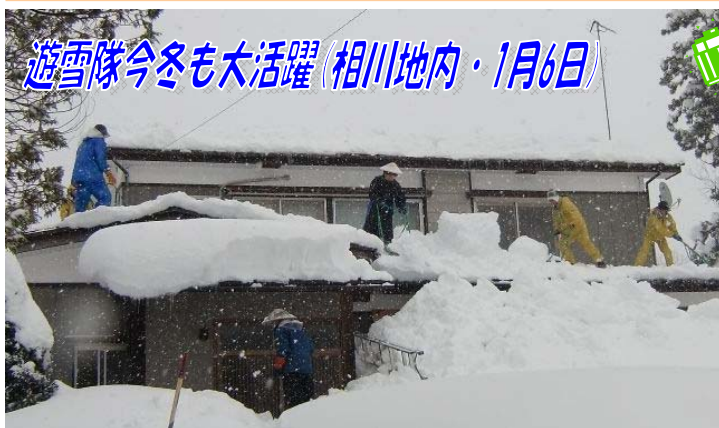
遊雪隊今冬も大活躍(相川地内・1月6日)

えちごかわぐち雪洞火ぼたる祭実行委員会事務局(川口支所産業建設課内) ☎89-3113