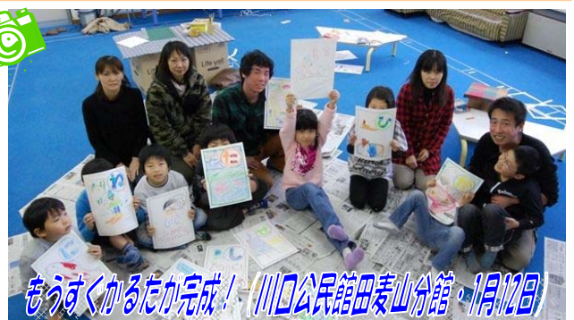
もうすぐかるた完成！(川口公民館田麦山分館・1月12日)

川口地域の除雪ボランティア「遊雪隊」が今冬も大活躍。根雪が早かったため今回で4回目、12名が2班に分かれ6戸の雪下ろしを行いました。これからもご支援よろしくお願ひします。