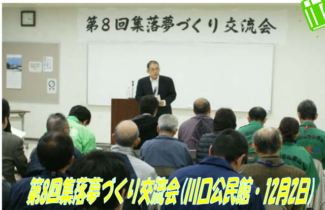
第8回集落夢づくり交流会(川口公民館・12月2日)

3 年生が 4 班に別れ「交通」、「高齢化」、「産業」、「絆」をテーマに今まで取り組んできた成果を、協力いただいた地域の皆さんなどを前に発表しました。