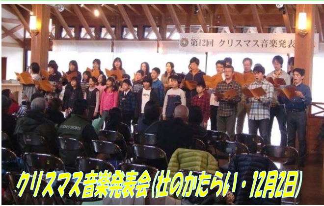
クリスマス音楽発表会(仕のかたらい・12月2日)

総勢 12 組が日頃の成果を発表しました。川口小学校統合 50 周年の記念歌「希望の絆」を歌った PTA の皆さんには、会場から温かな拍手が沸き起こりました。