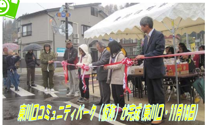
東川口コミュニティパーク(仮称)が完成(東川口・11月18日)

川口公民館田麦山分館新聞部が市の地域社会貢献褒賞を受賞しました。地域新聞「たむぎやま」を昭和 48 年 4 月から毎月発行し、長年にわたり地域に密着した情報を住民に届け地域振興に貢献したことが認められ今回の受賞となりました。