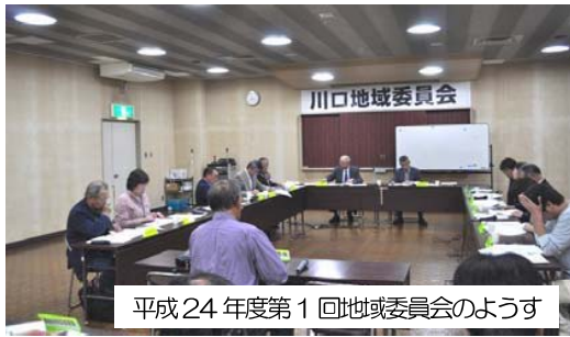
平成24年度第1回地域委員会のようす

長岡市では、市町村合併の協定に基づき、合併後も行政の目が隅々まで行き届くとともに、地域のことは地域で解決でき、安心して生活できる「地域住民と行政が一体となって進めるまちづくり」を行うため、市長の附属機関として14人からなる地域委員会を設置しています。