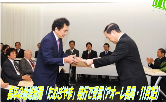
長年の地域新聞「たむぎやま」発行で受賞(アール長岡・11月2日)

11 月 4 日、新たに立ち上がった花壇づくりの会「なでしこの会」がパンジー・ピオラやチューリップの球根などを花壇に植えました。これは、地域のふれあいの場づくりや環境美化活動として「田麦山地域おこしの会」の事業の一つとして行われたもので、当日は多数の方が参加されました。