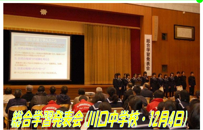
総合学習発表会(川口中学校・12月4日)

総勢 12 組が日頃の成果を発表しました。川口小学校統合 50 周年の記念歌「希望の絆」を歌った PTA の皆さんには、会場から温かな拍手が沸き起こりました。