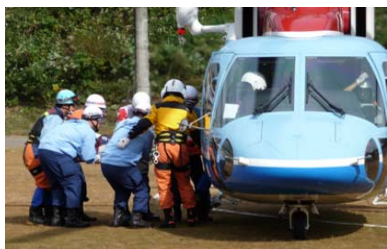
山古志地域での様子(平成21年度)

午前7時46分にM6.8の地震が発生！ ～運動公園で「市震災対策訓練」を開催します～