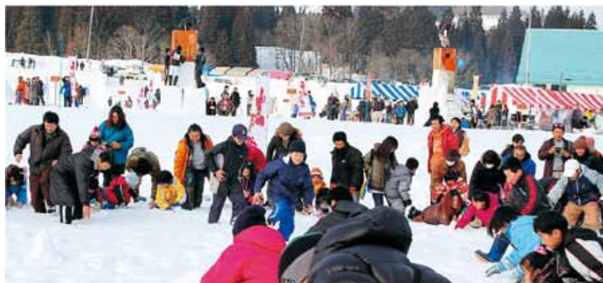
親子で雪の中の宝探