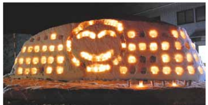
↓ 中山地区 (歓迎のスマイル)