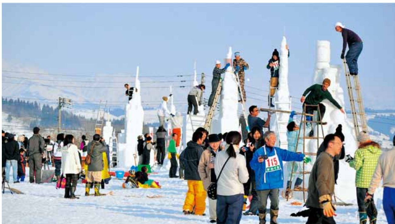
5mを超える雪積みで熱戦（優勝5.82m）17チーム参加