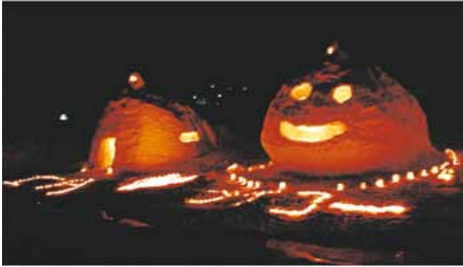
川口中学校1年生 (かまくら、スライム)