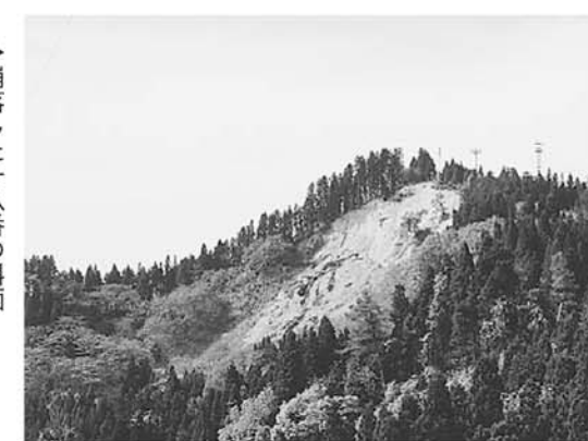
▶崩落した十八番の斜面

▼日差しが徐々に強くなり、暖かい日が続きます。山が青みを増すほどに地震で崩れた斜面がより際立って見え、一層地震の爪あとを生々しく映し出しています。誰もが忘れることのできない震度7の体験。今後の糧として安全で安心して暮らせる住み良い町に復興していくため、忘れてはいけない経験です。▼震災に負けない子どもたちの笑顔は、私たちに元気を与えてくれます。広報かわぐちでは元氣なかわぐちっこを紹介していきますので、希望の方はご連絡ください。