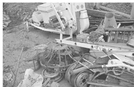
▲農機具は粗大ゴミとして回収できません。農協が許可業者に問い合わせください。有料です。