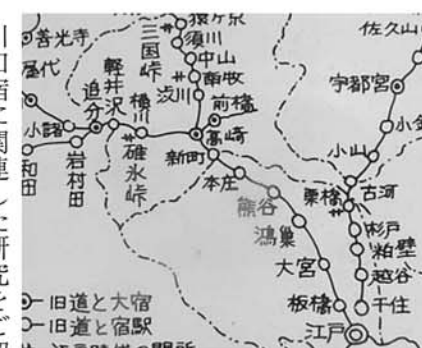
▲江戸から須川までの行程

川口宿に関連した研究をご紹介します。 (4) お国入りの行程 普段大名行列でも朝早く出発する。「お江戸日本橋七つ立ち初上