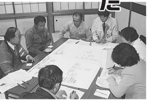
▲中山地区でのワークショップ

町内11地区に設置された「地区震災復興委員会」が4月19日から5月6日まで相次いで開催されました。委員会では、延べ161人が参加し、様々な意見・提案が出されるなど活発な話し合いが行われました。この委員会です話し合われた内容などをお知らせします。